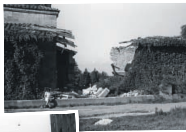
Mausoleum Evangelischer Friedhof, September 1946

an die E-Mail Adresse laud-ehr.daniela@regensburg.de gesendet werden. Wichtig ist die Angabe des Urhebers bzw. Rechteinhabers und dessen Einverständniserklärung, dass die Beiträge für das Video verwendet werden dürfen. Bei Rückfragen stehen die Mitarbeiter der