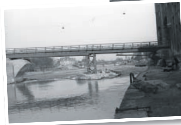
Behelfsbrücke Steinerne Brücke, März 1946

Stabsstelle Erinnerungs- und Gedenkkultur im Referat für Bildung unter Tel.: 0941/507-7017 zur Verfügung.