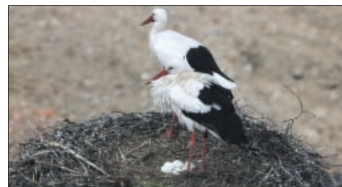
Auf dem Bild ist das Storchenpaar am Hundsmarkt bei der Kirche zu sehen

Traditionell gab es in Schierling lange Zeit nur ein Storchenpaar samt Horst - am Hundsmarkt gegenüber der Kirche. Vor rund zwei Jahren kam ein weiteres dazu und hat es sich auf dem Brauereiturm gemütlich gemacht. Jetzt ließ sich ein drittes Pärchen nieder - und zwar auf