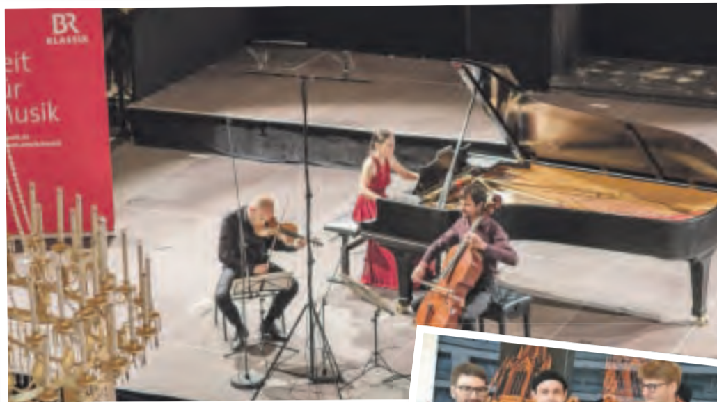
Das Trio Rafale (oben) zelebrierte beim 1. Kammermusikfestival Regensburg Johannes Brahms' Opus 8

2021 widmet sich das Festival, das vom Kulturverein Regensburg e.V. veranstaltet wird, schwerpunktmäßig dem russischen Komponisten Nikolai Roslawez (1881-1944), der mit der Entwicklung eines eigenen Tonsystems einer der Wegbereiter der Neuen Musik in Russland war. Mit den ästhetischen Vorstellungen des Stalinregimes nicht konform, geriet Roslawez vollkommen in Vergessenheit und wird erst in den letzten Jahrzehnten nach und nach wieder entdeckt. Kammermusikalische Wer-