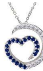
Art. CDZ-300-1 Zaf. ct. 0.17 Diam.ct.0.12 Gold 18 kt gr. 1.90