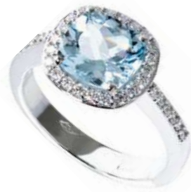
Art. AAM-8 Acquam.ct. 2,00 Diam. ct.0.35 Gold 18 kt gr. 4.50