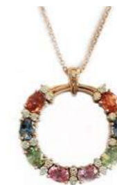
Art. CGZM-25R Zaf Mult. ct. 2,00 Diam. ct. 0,22 Gold 18 kt gr. 5,00