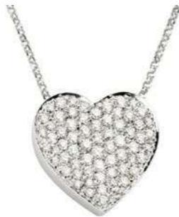
Art. CB 7815-3 Diam. ct. 0.45 Gold 18 kt. gr. 2.25 mm.1.20