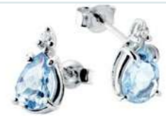
Art. OMG860 Orecchini AM ct. 2,00 Diam. ct.0,05 Gold 18 kt. gr. 1,30