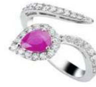
Art. ABZR-150 Zaff. Rosa ct.0,75 mm.7x5 Diam.ct.0.60 Gold 18 kt gr. 4,70