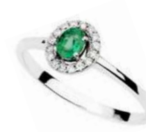
Art. AS43 Sme. ct.0,35 Diam. ct.0,18 Gold 18 kt gr. 2,50