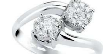
ADC78-3 Diam.ct.0,38 Gold 18 kt. gr. 4,50