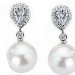
Art. OBP-166 Diam.Goccia ct.0,80 Perle mm. 13.00 Diamanti ct.0.34 Gold 18 kt gr. 3.50