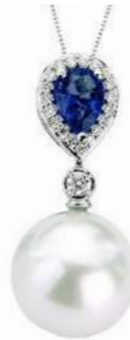
Art. CZP-166 Zaff. ct.0.75 Perla mm. 12.00 Diamanti ct.0.18 Gold 18 kt gr. 2,60