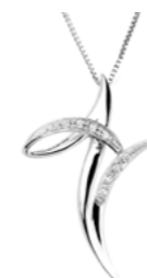
Art. CRO306 Diam. ct. 0,04 Gold 18 kt. gr. 1,75 Mis.cm. 2,80