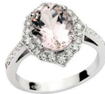
Art. AMR-911 Morganite ct.3.20 Diam.ct.0,70 Gold 18 kt gr. 5,80