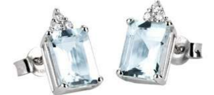
Art. OME860-3 Orecchini AM ct. 2,50 Diam. ct.0,09 Gold 18 kt. gr. 1,65