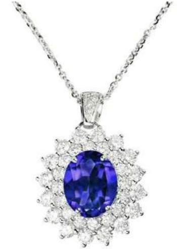
Art. CTN 8021-2 Tanzanite ct. 1.90 Diam. ct. 1.45 F-SI Gold 18 kt gr. 4.90