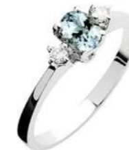
Art. AAM50 Anello AM ct.0,30 Diam.ct.0,06 Gold 18 kt. gr. 2,10