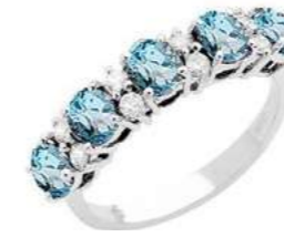
Art. AAM30-5 Anello AM. ct.1,50 Diam. ct.0,08 Gold 18 kt gr. 2,70