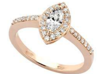
Art. ADN-340R Diam. Nav. ct. 0,34 Diam.ct.0.30 Gold 18 kt gr. 3,90