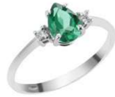
Art. ASG750 Sme.ct.0,60 Diam.ct.0,04 Gold 18 kt. Gr.2,10