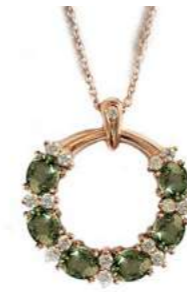
Art. CGZV-20R-1 Zaf. Verde ct. 1.50 Diam. ct. 0.18 Gold 18 kt. gr. 3,80