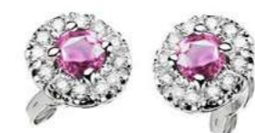
Art. OZR100 Zaff.Rosa ct.1,00 mm 4 Diam.ct.0,24 Gold 18 kt. gr. 2,70