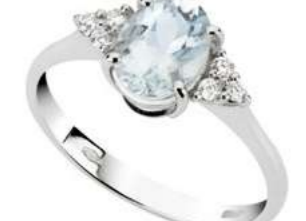
Art. AMO860-3 Anello AM ct. 1.00 Diam. ct.0,09 Gold 18 kt. gr. 2,30