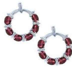
Art. OGR-20-1 Rub ct. 2.60 Diam. ct. 0.40 Gold 18 kt. gr. 6,00