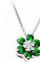
Art. CS70 Pendente Sme. ct.0,12 Diam. ct. 0,02 Gold 18 kt gr. 1,20