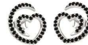
Art. ON-300-1 Diam. neri. ct.0.66 Gold 18 kt gr. 2.00