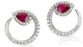
Art. ORD-155 Rub. ct. 0,90 mm.6x4 Diam.ct. 0,60 Gold 18 kt. gr. 4,80