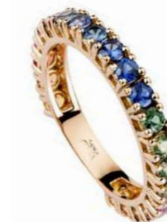
Art. FGM-25/ FGM25R Eternelle Oro Bianco e Oro Rosa Zaffiri Multicolor mm. 2.5 ct 1.50 Gold 18 kt. gr. 2.40