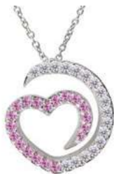
Art. CDZR-300-1 Zaf. rosa ct. 0.17 Diam.ct.0.12 Gold 18 kt gr. 1.90