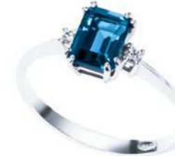
Art. ABLE860 Anello TBL ct. 1,90 Diam. ct.0,05 Gold 18 kt. gr. 2,50