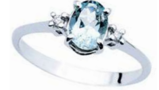
Art. AMO860 Anello AM ct. 1.00 Diam. ct.0,05 Gold 18 kt. gr. 2,30