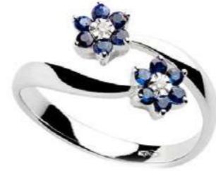
Art.AZ70-1 Anello Zaff. ct. 0,50 Diam. ct. 0,04 Gold 18 kt gr. 3,40