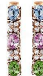
Art. ODZM-31-BRV Zaf multicolor. ct.1.40 Diam.ct.0.20 Gold 18 kt gr. 2,00