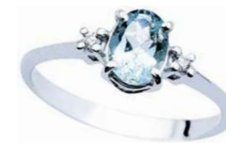
Art. AMO810 Anello AM ct. 2.40 Diam. ct.0,05 Gold 18 kt. gr. 2,20