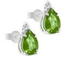
Art. OPG750 Sme.ct.1,20 Diam.ct.0,04 Gold 18 kt. Gr.1,20