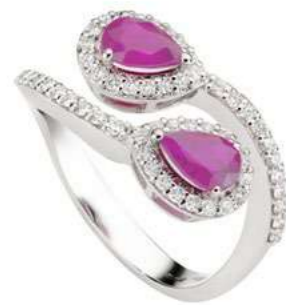
Art. ABZRC-150-1 Zaff. Rosa ct.1,50 mm.7x5 Diam.ct.0,55 Gold 18 kt gr. 4,90