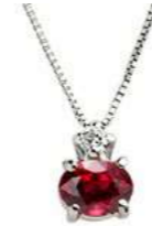
Art. CR50 Pendente Rub. ct.0,50 Diam.ct.0,03 Gold 18 kt. gr. 1,10