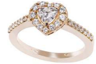
Art. ADC-340R Diam. Cuore. ct.0,34 Diam.ct.0.25 Gold 18 kt gr. 4,50