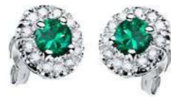
Art OS100 Sme.ct. 0.50 mm 4 Diam. ct. 0.24 Gold 18 kt. gr. 2,70