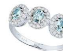
Art. TBAM34 AM ct.0,50 Diam. ct.0,25 Gold 18 kt gr. 3,00