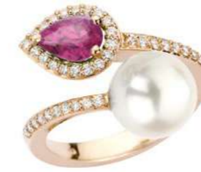
Art. AZRP-166R Zaff.Rosa ct.0.80 Perla mm.10/10.5 Diam.ct.0.30 Gold 18 kt gr. 4.80