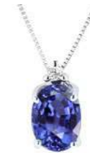
Art. CTNO750 Tanzanite ct.0,80 Diam. ct.0,02 Gold 18 kt. gr. 1,10