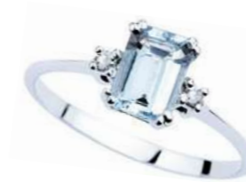
Art. AME640 Anello AM ct. 0.40 Diam. ct.0,03 Gold 18 kt. gr. 1,50