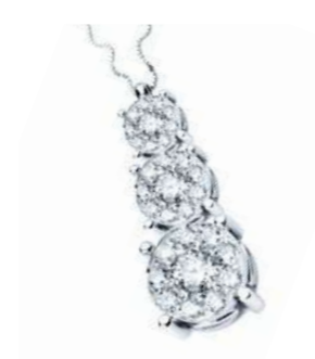
CDT78-123 Diam. centr. ct.0,23 Diam. ct. 0,32 Gold 18 kt. gr. 3,80