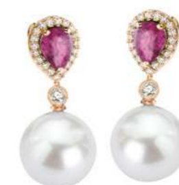
Art. OZRP-166R Zaff.Rosa ct. 1.60 Perle mm. 13.00 Diamanti ct.0.34 Gold 18 kt gr. 3.50