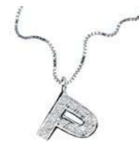
Art. CD900-P LETTERINA "P" Diam. ct.0.04 Gold 18 kt. gr. 1,37