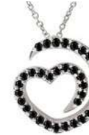
Art. CN-300-1 Diam. neri. ct.0.34 Gold 18 kt gr. 1.90