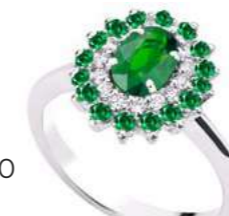
Art. AS88S Sme. ct. 0,33 Sme. ct. 0,20 Diam. ct.0,10 Gold 18 kt gr. 2,80