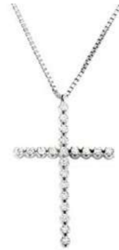
Art. CRO283 21 Diam. ct.0.21 Gold 18 kt. gr. 2,10 2,9x2,0 cm