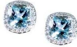
Art. OAM-8 Acquam.ct. 4,00 Diam. ct.0.40 Gold 18 kt gr. 4.00