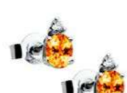
Art. OZY40 Zaff.Orange . ct. 0,23 Diam. ct. 0,03 Gold 18 kt. Gr. 0,90