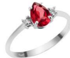
Art. ARG750 Rubino ct. 0,75 Diam. ct.0,04 Gold 18 kt. gr. 2,10