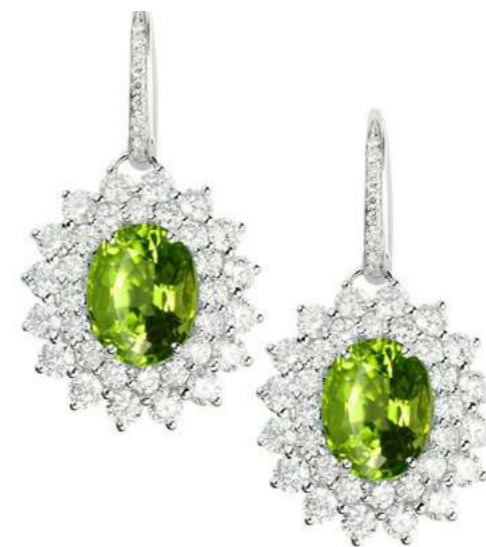
Art. OPRD 8021-2 Peridoto ct. 3.80 Diam. ct. 2.96 F-SI Gold 18 kt gr. 7.50