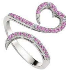
Art. ADZR-300-3 Zaf. rosa ct. 0.36 Diam.ct.0.07 Gold 18 kt gr. 3.50