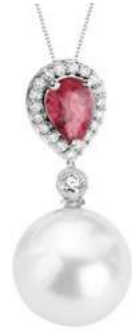
Art. CRP-166 Rub. ct.0.70 Perla mm. 12.00 Diamanti ct.0.18 Gold 18 kt gr. 2,60