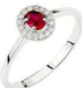
Art. AR34-1 Rub. ct.0,25 Diam. ct.0,10 Gold 18 kt gr. 1,80