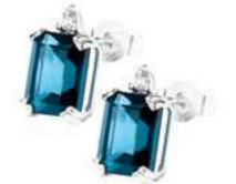
Art. OBLE750 Orecchini TBL ct. 2,80 Diam. ct.0,04 Gold 18 kt. gr. 1,30