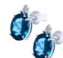
OBLO810 Orecchini TBL. ct. 6,60 D.c t. 0,05 Gold 18 kt. gr. 1,90