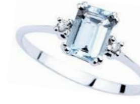
Art. AME750 Anello AM ct. 0.90 Diam. ct.0,04 Gold 18 kt. gr. 1,80