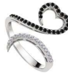
Art. ADN-300-1 Diam. neri. ct.0.25 Diam.ct.0.12 Gold 18 kt gr. 3.50