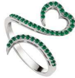
Art. AS-300-1 Sme. ct. 0.35 Gold 18 kt gr. 3.50