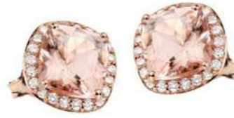
Art. OMR-8R Morg. ct. 4,00 Diam. ct.0.40 Gold 18 kt gr. 4.00