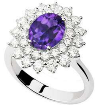
Art. AAMT 8021-3 Ametista ct. 1.80 Diam. ct. 1.30 F-SI Gold 18 kt gr. 5.80