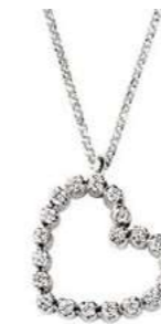
Art. CD751 20 Diam.ct.0.19 Gold 18 kt. 2.10