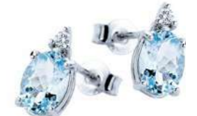
Art. OMO860 Orecchini AM ct. 2,00 Diam. ct.0,05 Gold 18 kt. gr. 1,30