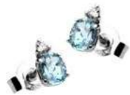
Art. OAM40 Acquam. ct. 0,30 Diam. ct. 0,03 Gold 18 kt. Gr. 0,90