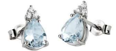
Art. OMG860-3 Orecchini AM ct. 2,00 Diam. ct.0,09 Gold 18 kt. gr. 1,50