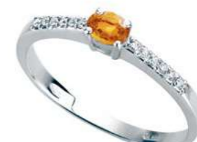
Art. AZO35-1 Zaff.Orange ct. 0,25 Diam.ct.0,10 Gold 18 kt. gr. 1,80