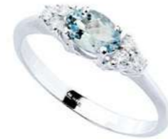
Art. AAM51-1 Anello AM. ct. 0,40 Diam. ct.0,11 Gold 18 kt gr. 2,20