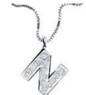
Art. CD900-N LETTERINA "N" Diam. ct.0.05 Gold 18 kt. gr. 1,40