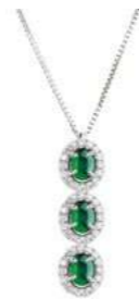
Art. CDTS34 Sme. ct. 0,66 Diam. ct.0,50 Gold 18 kt gr. 2,30