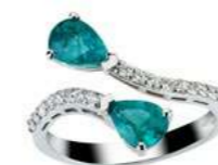
Art. ADSC-59 Sme. ct. 1,20 Diam. ct.0.35 Gold 18 kt gr. 3.90