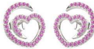
Art. OZR-300-1 Zaf. rosa ct. 0.70 Gold 18 kt gr. 2.00