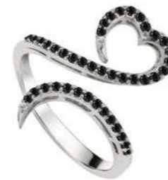
Art. ADN-300-2 Diam. neri. ct. 0.44 Diam.ct.0.02 Gold 18 kt gr. 3.50