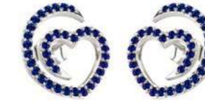
Art. OZ-300-1 Zaf. ct. 0.66 Gold 18 kt gr. 2.00