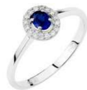
Art. AZ34-1 Zaff. ct.0,25 Diam. ct.0,10 Gold 18 kt gr. 1,80