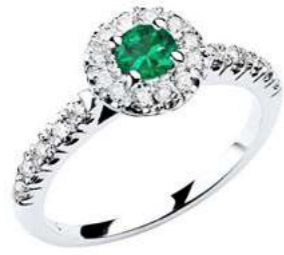
Art AS100 Sme. ct. 0.25 mm 4 Diam. ct. 0.20 Gold 18 kt. gr. 3,00