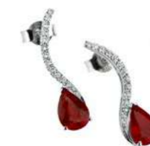
Art. ODR-59 Rub. ct. 1,70 Diam. ct.0.20 Gold 18 kt gr. 2.00