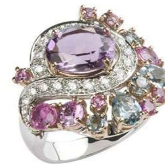
Art. ABV 8960-1 Ametista ct. 2.40 Zaffiro ct. 2.25 Acquamarina ct.0.42 Diam. ct. 0.050 F-SI Gold 18 kt gr. 11.50