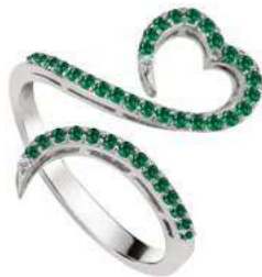
Art. ADS-300-2 Sme. ct. 0.35 Diam.ct.0.02 Gold 18 kt gr. 3.50