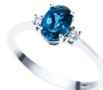
ABLO911 Anello TBL. ct. 4,40 Diam. ct.0,06 Gold 18 kt. gr. 2,30