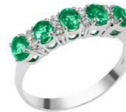
Art. AS25 Anello Sme. ct.0,85 Diam. ct.0,12 Gold 18 kt gr. 2,70