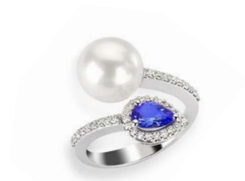
Art. ATNP-166 Tanzanite ct.0.70 Perla mm.10/10.5 Diam.ct.0.30 Gold 18 kt gr. 4.80