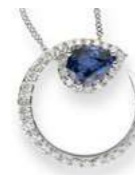
Art. CZD-155 Zaff. ct. 0,80 mm.7x5 Diam.ct. 0,50 Gold 18 kt. gr. 3,30