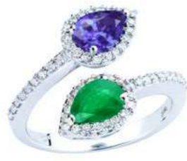
Art. ABSTN 165-2 Tanzaniti ct.0,70 Smeraldo ct.0,60 Diam.ct. 0.40 Gold 18 kt gr. 5,40