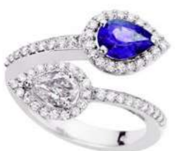
Art. ABTN-166 Tanzanite ct.0.70 Diam. Goccia ct.0.40 Diam.ct.0.40 Gold 18 kt gr. 5,00