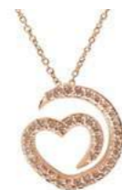
Art. CDB-300-1R Diam. brown ct.0.25 Gold 18 kt gr. 1.90