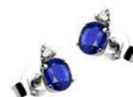
Art. OZ40 Zaf. ct. 0,50 Diam. ct. 0,03 Gold 18 kt. Gr. 0,90