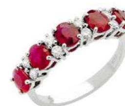
Art. AR30-5 Anello Rub. ct.2,35 Diam. ct.0,08 Gold 18 kt gr. 2,70