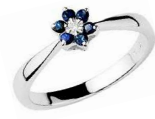
Art. AZ70 Anello Zaff. ct. 0,25 Diam. ct. 0,02 Gold 18 kt gr. 2,30