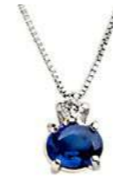
Art. CZ50 Pendente Zaff. ct.0,48 Diam.ct.0,03 Gold 18 kt. gr. 1,10