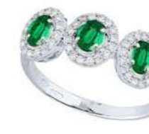
Art. TBS34 Sme. ct.0,50 Diam. ct.0,25 Gold 18 kt gr. 3,00