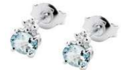
Art. OAM50 Orecchini AM ct.0,60 Diam.ct.0,06 Gold 18 kt. gr. 1,10