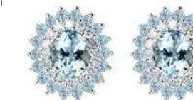
Art. OAM88AM Acq. ct. 0,60 Acq. ct. 0,40 Diam. ct.0,20 Gold 18 kt gr. 3,00