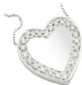
Art. CB 6735 Diam. ct.0.28 Gold 18 kt. gr. 4,50