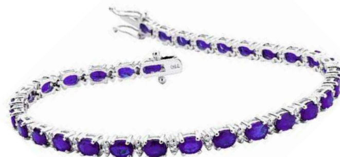
Art. BTAN-54/18 Tanzaniti ct. 8,50 mm. 5x4 Diam. ct. 1,00 Gold 18 kt. gr. 11,80 cm. 18,00