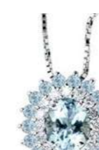
Art. CAM88AM Acq. ct. 0,30 Acq. ct. 0,20 Diam. ct.0,10 Gold 18 kt gr. 1,90