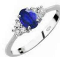
Art. AZ50-2 Anello Zaff. ct.0,60 Diam.ct.0,15 Gold 18 kt. gr. 1,90