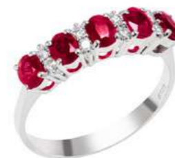
Art. AR25 Anello Rub. ct.1,00 Diam. ct.0,12 Gold 18 kt gr. 2,70