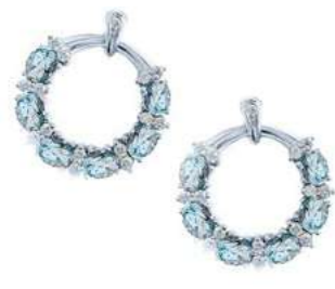
Art. OGAM-20-1 Acq. ct. 2.20 Diam. ct. 0.40 Gold 18 kt. gr. 6,00