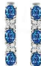
Art. ODZC-31 Zaf light blue. ct.1.40 Diam.ct.0.20 Gold 18 kt gr. 2,00