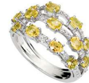
Art. ADZY 8713 Zaffiri Yellow ct.2,20 Diam.ct.0,45. Gold 18 kt. gr. 6,00