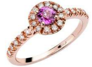
Art. AZR100-R Zaff.Rosa ct.0,50 mm 4 Diam.ct.0,20 Gold 18 kt. gr. 3,00