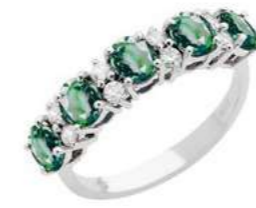
Art. AS30-5 Anello Sme. ct.1,65 Diam. ct.0,08 Gold 18 kt gr. 2,70