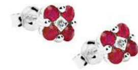
Art.OR60 Orecchini Rub. ct. 0,70 Diam. ct. 0,03 Gold 18 kt gr. 1,80