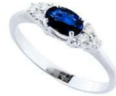
Art. AZ51-1 Anello Zaf. ct. 0,60 Diam. ct.0,11 Gold 18 kt gr. 2,20