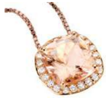
Art. CMR-8-1R Morg. ct. 2,00 Diam. ct.0.20 Gold 18 kt gr. 2.70