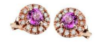
Art. OZR100-R Zaff.Rosa ct.1,00 mm 4 Diam..ct.0,24 Gold 18 kt. gr. 2,70