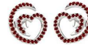
Art. OR-300-1 Rub. ct. 0.66 Gold 18 kt gr. 2.00