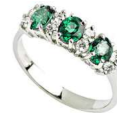
Art. AS30-3 Anello Sme. ct.1,00 Diam. ct.0,08 Gold 18 kt gr. 2,45