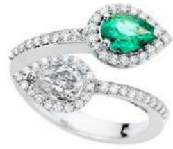
Art. ABS 166 Sme. ct.0.60 Diam.Goccia ct.0.40 Diam.ct. 0.40 Gold 18 kt. gr. 5.00