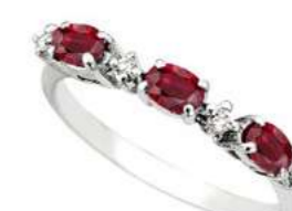
Art. TR40 Rub. ct. 0,70 Diam. ct. 0,05 Gold 18 kt. Gr. 1,80