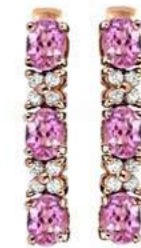
Art. ODZR-31 Zaf rosa ct.1.40 Diam.ct.0.20 Gold 18 kt gr. 2,00