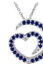
Art. CDZ-300-3 Zaf. ct. 0.28 Diam.ct. 0.04 Gold 18 kt gr. 3.50