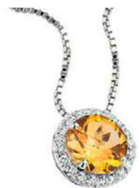
Art. CCT 160 Citrino Diam.ct.0,11 Gold 18 kt. gr. 1,75