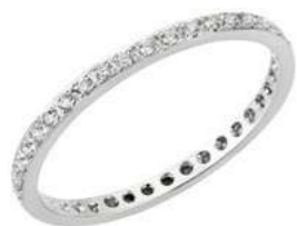
Art. FD 320-11 Diam. ct.0,32 Gold 18 kt. gr. 1,70 MIS. 11