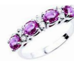
Art. AZR31 Anello Zaf. Rosa.ct.1,70 Diam. ct.0,15 Gold 18 kt gr. 2,80