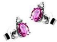
Art. OZR40 Zaff.Rosa ct. 0,46 Diam. ct. 0,03 Gold 18 kt. Gr. 0,90