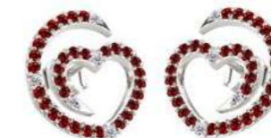
Art. ODR-300-3 Rub. ct. 0.56 Diam.ct.0.08 Gold 18 kt gr. 2.00