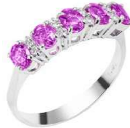
Art. AZR25 Anello Zaf. Rosa ct.1,15 Diam. ct.0,12 Gold 18 kt gr. 2,70