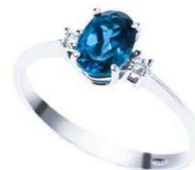
ABLO810 Anello TBL. ct. 3,30 Diam. ct.0,05 Gold 18 kt. gr. 2,20