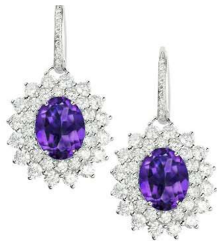
Art. OAMT 8021-2 Ametista ct. 3.80 Diam. ct. 2.96 F-SI Gold 18 kt gr. 7.50