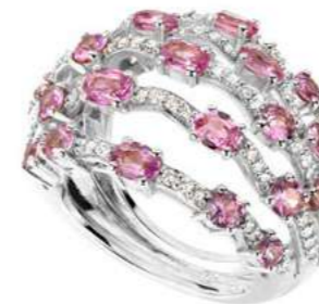
Art. ADZR 8723 Zaffiri Rosa ct.3,60 Diam.ct.0,65. Gold 18 kt. gr. 11,00