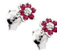
Art. OR70 Orecchini Rub. ct. 0,50 Diam. ct. 0,04 Gold 18 kt gr. 1,25