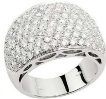
Art. AB 7537 Diam. ct. 3.13 Gold 18 kt. gr. 13,00