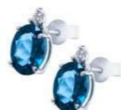
Art. OBLO750 Orecchini TBL ct. 1,80 Diam. ct.0,04 Gold 18 kt. gr. 1,05