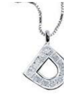
Art. CD900-D LETTERINA "D" Diam. ct.0.04 Gold 18 kt. gr. 1,45