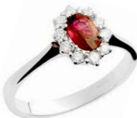
Art. AR10 Anello Rub. ct.0,63 Diam. ct.0,20 Gold 18 kt gr. 2,60