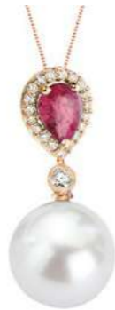
Art. CRP-166R Rub. ct.0.70 Perla mm. 12.00 Diamanti ct.0.18 Gold 18 kt gr. 2,60