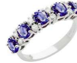
Art. AZ30-5 Anello Zaf. ct.2,40 Diam. ct.0,08 Gold 18 kt gr. 2,70