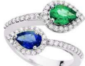
Art. ASZ-166 Smeraldo ct.0.60 Zaff. ct.0.75 Diam.ct. 0.40 Gold 18 kt gr. 5,40