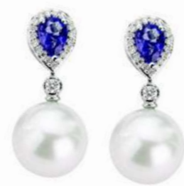
Art. OZP-166 Zaff. ct. 1.50 Perle mm. 13.00 Diamanti ct.0.36 Gold 18 kt gr. 3.50