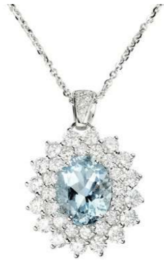
Art. CAM 8021-2 Acquamarina ct. 1.80 Diam. ct. 1.45 F-SI Gold 18 kt gr. 4.90