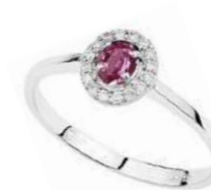
Art. AZR43 Zaff. Rosa ct.0,45 Diam. ct.0,18 Gold 18 kt gr. 2,50