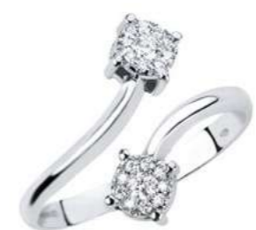
ADC77-1 Diam.ct.0,14 Gold 18 kt. gr. 3,50