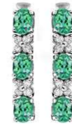
Art. ODS-31 Sme. ct.1.20 Diam.ct.0.20 Gold 18 kt gr. 2,00