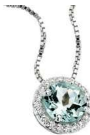
Art. CAM 160 Acquamarina ct. 0.70 Diam.ct.0,11 Gold 18 kt. gr. 1,75