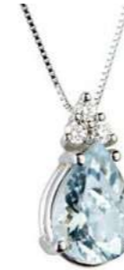
Art. CMG860-3 Pendente AM ct. 1,00 Diam. ct.0,045 Gold 18 kt. gr. 1,25