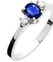
Art. AZ50 Anello Zaff. ct.0,50 Diam.ct.0,06 Gold 18 kt. gr. 2,10