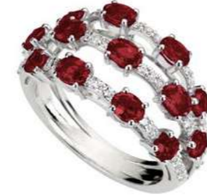
Art. ADR 8713 Rubini ct.2,20 Diam.ct.0,45. Gold 18 kt. gr. 6,00