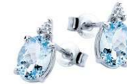
Art. OMO750 Orecchini AM ct. 1,50 Diam. ct.0,04 Gold 18 kt. gr. 1,05