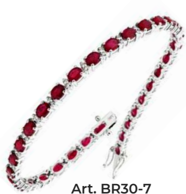
Art. BR30-7 Bracciale Rub. ct.5.94 Diam. ct.0.86 Gold 18 kt gr. 11,00