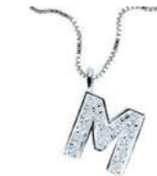
Art. CD900-M LETTERINA "M" Diam. ct.0.05 Gold 18 kt. gr. 1,45