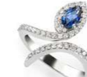
Art. ABZ-155 Art. ABZ-155-1 Zaff. ct. 0,50 Zaff. ct. 0,80 mm.6x4 mm.7x5 Diam.ct. 0,42 Diam.ct. 0,50 Gold 18 kt. gr. 4,50 Gold 18 kt. gr. 5,50