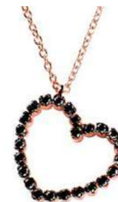
Art. CDB752 24 Black Diam.ct.0.26 Gold 18 kt.2.40