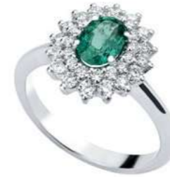
Art. AS88 Anello Sme. ct. 0,33 Diam. ct.0,30 Gold 18 kt gr. 2,80