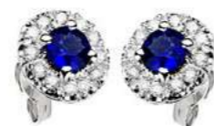
Art OZ100 Zaff.ct. 0.60 mm 4 Diam. ct. 0.24 Gold 18 kt. gr. 2,70