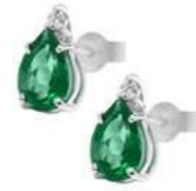
Art. OSG750 Sme.ct.1,20 Diam.ct.0,04 Gold 18 kt. Gr.1,20