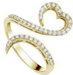
Art. AD-300-1G Diam. ct. 0.35 Gold 18 kt gr. 3.50