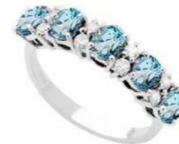
Art. AAM30 Anello AM.ct.1.50 Diam. ct.0,26 Gold 18 kt gr. 3,90