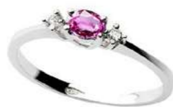
Art. AZR40 Zaff.Rosa. ct. 0,23 Diam. ct. 0,03 Gold 18 kt. Gr. 1,50