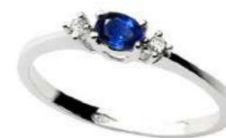
Art. AZ40 Zaf. ct. 0,25 Diam. ct. 0,03 Gold 18 kt. Gr. 1,50