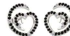
Art. ODN-300-3 Diam. neri. ct.0.60 Diam.ct.0.08 Gold 18 kt gr. 2.00