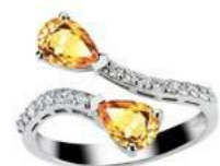
Art. ADZYC-59 Zaf yellow ct. 1,20 Diam. ct.0.35 Gold 18 kt gr. 3.90