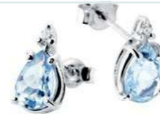
Art. OMG640 Orecchini AM ct. 0.65 Diam. ct.0,03 Gold 18 kt. gr. 0,95