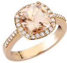
Art. AMR-8R Morg. ct. 2,00 Diam.ct.0.35 Gold 18 kt gr. 4.50