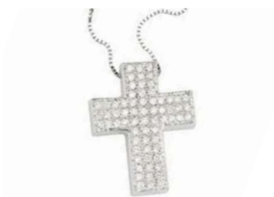
Art. CB 6721-1 Diam. ct.0.45 Gold 18 kt. gr. 3,90 Mis.cm. 1.90