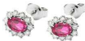
Art. OZR10 Orecchini Zaff.Rosa ct.1,10 Diam. ct.0,40 Gold 18 kt gr. 2,90