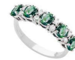
Art. AS30 Anello Sme. ct.1.65 Diam. ct.0,26 Gold 18 kt gr. 3,90