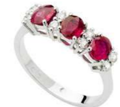
Art. AR30-1 Anello Rub. ct.1,45 Diam. ct.0,26 Gold 18 kt gr. 3,45