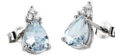
Art. OMG640-3 Orecchini AM ct. 0.65 Diam. ct.0,09 Gold 18 kt. gr. 1,20