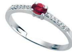
Art. AR35-1 Rub.ct.0,25 Diam.ct.0,10 Gold 18 kt. gr. 1,80