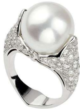
Art. ABP 8753 Perla Australia mm.14 Diam. ct. 2.44 F-SI Gold 18 kt gr. 8.50