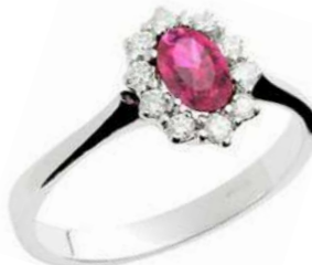
Art. AZR10 Anello Zaff. Rosa ct.0,55 Diam. ct.0,20 Gold 18 kt gr. 2,60