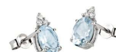
Art. OMO750-3 Orecchini AM ct. 1,50 Diam. ct.0,09 Gold 18 kt. gr. 1,45