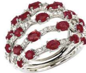
Art. ADR 8723 Rubini ct.3,60 Diam.ct.0,65. Gold 18 kt. gr. 11,00