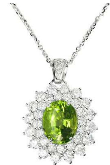
Art. CPRD 8021-2 Peridoto ct. 1.90 Diam. ct. 1.45 F-SI Gold 18 kt gr. 4.90