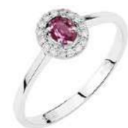
Art. AZR34-1 Zaff.Rosa ct.0,30 Diam. ct.0,10 Gold 18 kt gr. 1,80