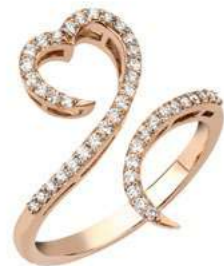
Art. AD-300-1R Diam. ct. 0.35 Gold 18 kt gr. 3.50