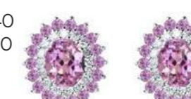
Art. OZR88ZR Zaf rosa. ct. 0,80 Zaf rosa. ct. 0,40 Diam. ct.0,20 Gold 18 kt gr. 3,00