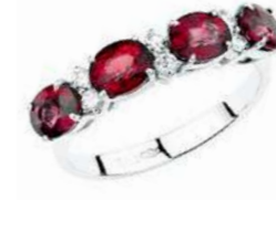
Art. AR31 Anello Rub. ct.1.90 Diam. ct.0,15 Gold 18 kt gr. 2,80