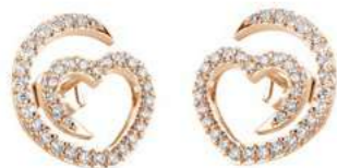
Art. OD-300-1R Diam.ct.0.50 Gold 18 kt gr. 2.00