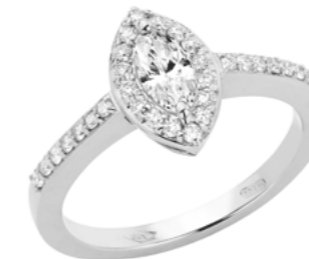
Art. ADN-340 Diam. Nav. ct. 0,34 Diam.ct.0.30 Gold 18 kt gr. 3,90