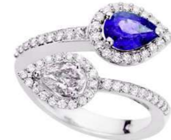
Art. ABZ-170 Zaff. ct. 0.75 1 Diam.Goccia ct.0.44 Diam.ct. 0.80 Gold 18 kt. gr. 8.00