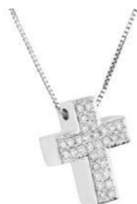
Art. CB 6158-1 Diam. ct.0.18 Gold 18 kt. gr. 2,40 Mis.cm. 1.30