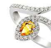
Art. ABZY-155 Art. ABZY-155-1 Zaff. Yellow ct. 0,50 Zaff. Yellow ct. 0,80 mm.6x4 mm.7x5 Diam.ct. 0,42 Diam.ct. 0,50 Gold 18 kt. gr. 4,50 Gold 18 kt. gr. 5,50