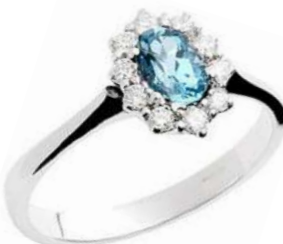
Art. AAM10 Anello AM.ct.0,45 Diam. ct.0,20 gr. 2,60