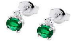
Art. OS50 Orecchini Sme.ct.0,70 Diam.ct.0,06 Gold 18 kt. gr. 1,10