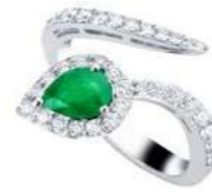
Art. ABS-150 Sme. ct.0,50 mm.7x5 Diam.ct.0.60 Gold 18 kt gr. 4,70