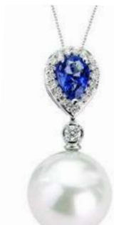
Art. CTNP-166 Tanzanite ct.0.70 Perla mm. 12.00 Diamanti ct.0.18 Gold 18 kt gr. 2,60