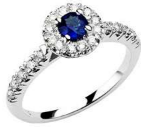
Art AZ100 Zaff. ct. 0.30 mm 4 Diam. ct. 0.20 Gold 18 kt. gr. 3,00