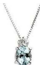
Art. CAM50/1 Pendente AM ct.0,30 Diam. ct.0,03 Gold 18 kt gr.1,10