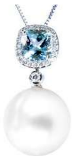
Art. CAMP-8-1 Perla mm. 12.00/12.50 Acquam.ct. 2,00 Diam. ct.0.25 Gold 18 kt gr. 3.45