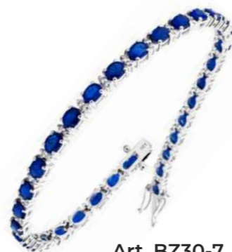
Art. BZ30-7 Bracciale Zaf. ct.5.90 Diam. ct.0.86 Gold 18 kt gr. 11,00