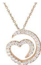
Art. CD-300-1R Diam.ct.0.25 Gold 18 kt gr. 1.90