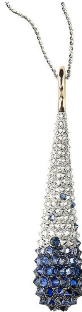
Art. CBZ 8800-1 Zaffiri ct. 6.55 Diam. ct. 3,50 F-SI Gold 18 kt gr. 10,50