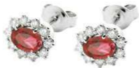
Art. OR10 Orecchini Rub. ct.1,26 Diam. ct.0,40 Gold 18 kt gr. 2,90