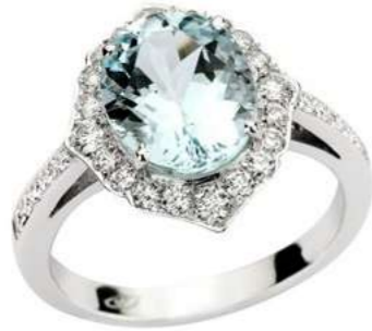
Art. AMM-810 Acquamarina ct.2.40 Diam.ct.0,50 Gold 18 kt gr. 4,60