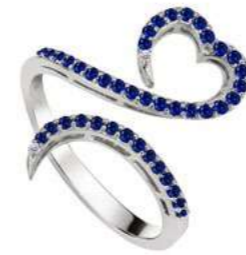
Art. ADZ-300-2 Zaf. ct. 0.44 Diam.ct.0.02 Gold 18 kt gr. 3.50