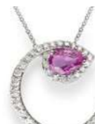
Art. CZRD-155 Zaff. Rosa ct.0,80 mm.7x5 Diam.ct. 0,50 Gold 18 kt. gr. 3,30