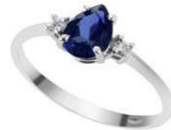
Art. AZG750 Zaffiro ct.0,80 Diam. ct.0,04 Gold 18 kt. gr. 2,10