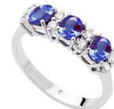
Art. AZ30-3 Anello Zaf. ct.1,45 Diam. ct.0,08 Gold 18 kt gr. 2,45