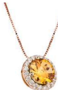
Art. CCT 160R Citrino Diam.ct.0,11 Gold 18 kt. gr. 2.10