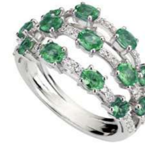
Art. ADS 8713 Smeraldi ct.1,85 Diam.ct.0,45. Gold 18 kt. gr. 6,00