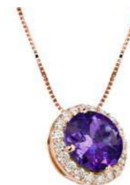
Art. CMT 160R Ametista Diam.ct.0,11 Gold 18 kt. gr. 2.10