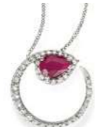
Art. CRD-155 Rub. ct. 0,75 mm.7x5 Diam.ct. 0,50 Gold 18 kt. gr. 3,30