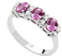
Art. AZR30-1 Anello Zaff. Rosa ct.1,20 Diam. ct.0,26 Gold 18 kt gr. 3,45