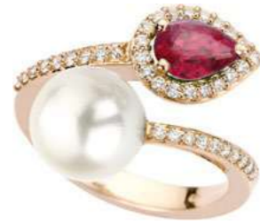
Art. ARP-166R Rub. ct.0.70 Perla mm. 12.00 Diamanti ct.0.18 Gold 18 kt gr. 4,80