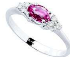
Art. AZR51-1 Anello Zaf. Rosa ct. 0,60 Diam. ct.0,11 Gold 18 kt gr. 2,20