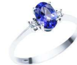
Art. ATNO750 Tanzanite ct.0,80 Diam. ct.0,04 Gold 18 kt. gr. 2,10