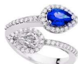
Art. ABZ 166 Zaff. ct. 0.80 Diam. Goccia ct.0.40 Diam.ct. 0.40 Gold 18 kt gr. 5,00