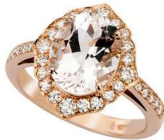
Art. AMR-810R Morganite ct.2.55 Diam.ct.0,50 Gold 18 kt gr. 4,60