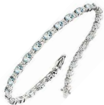
Art. BAM30-7 Bracciale AM. ct.4.80 Diam. ct.0.86 Gold 18 kt gr. 11,00