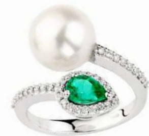
Art. ASP-166 Smeraldo ct.0.65 Perla mm.10/10.5 Diam.ct.0.30 Gold 18 kt gr. 4.80