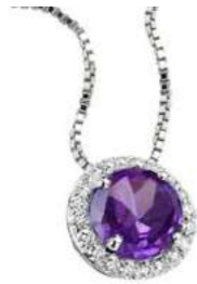
Art. CMT 160 Ametista Diam.ct.0,11 Gold 18 kt. gr. 1,75