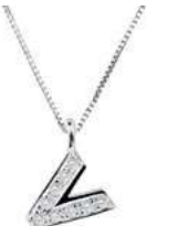
Art. CD900-V LETTERINA "V" Diam. ct.0.03 Gold 18 kt. gr. 1,22