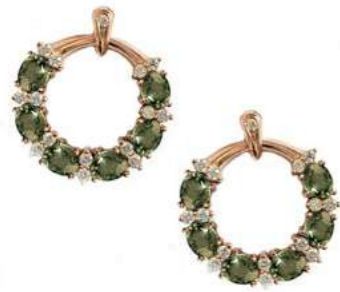
Art. OGZV-20R-1 Zaf. Verde ct. 3.00 Diam. ct. 0.40 Gold 18 kt. gr. 6,00