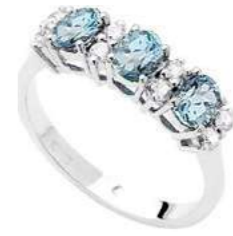
Art. AAM30-3 Anello AM. ct.0,90 Diam. ct.0,08 Gold 18 kt gr. 2,45