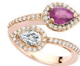
Art. ABZR-170R Zaff. Rosa ct. 0.80 Diam. Goccia ct.0.44 Diam.ct. 0.80 Gold 18 kt gr. 8,00