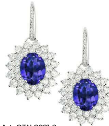
Art. OTN 8021-2 Tanzanite ct. 3.80 Diam. ct. 2.96 F-SI Gold 18 kt gr. 7.50