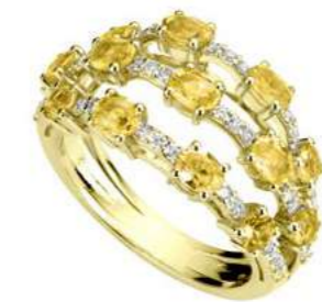
Art. ADZY 8713G Zaffiri Yellow ct.2,20 Diam.ct.0,45. Gold 18 kt. gr. 6,00