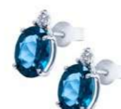
Art. OBLO970 Orecchini TBL ct. 4.30 Diam. ct.0,05 Gold 18 kt. gr. 2.00