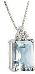
Art. CME750-3 Pendente AM ct. 0.90 Diam. ct.0,045 Gold 18 kt. gr. 1,25