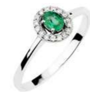
Art. AS34-1 Sme. ct.0,17 Diam. ct.0,10 Gold 18 kt gr. 1,80