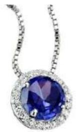
Art. CIT 160 Iolite Diam.ct.0,11 Gold 18 kt. gr. 1,75