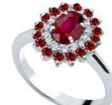
Art. AR88R Rub. ct. 0,40 Rub. ct. 0,20 Diam. ct.0,10 Gold 18 kt gr. 2,80