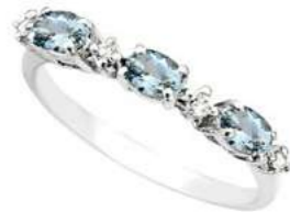
Art. TAM40 Acquam. ct. 0,45 Diam. ct. 0,05 Gold 18 kt. Gr. 1,80