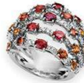
Art. ADZO 8723 Zaffiri Orange ct.3,60 Diam.ct.0,65. Gold 18 kt. gr. 11,00