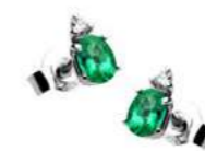
Art. OS40 Sme. ct. 0,35 Diam. ct. 0,03 Gold 18 kt. Gr. 0,90