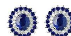
Art. OZ88Z Zaf. ct. 0,80 Zaf. ct. 0,40 Diam. ct.0,20 Gold 18 kt gr. 3,00