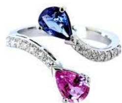
Art. ATZRC-59 Tanz. ct.0,70 Zaf rosa. ct. 0,85 Diam. ct.0.35 Gold 18 kt gr. 3.90