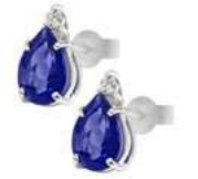
Art. OTNG750 Tanzanite ct.1.60 Diam. ct.0,04 Gold 18 kt. gr. 1,20