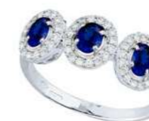
Art. TBZ34 Zaff. ct.0,70 Diam. ct.0,25 Gold 18 kt gr. 3,00