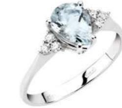
Art. AMG750-3 Anello AM ct. 0.60 Diam. ct.0,09 Gold 18 kt. gr. 2,20