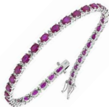
Art. BZR30-7 Bracciale Zaf. Rosa ct.6.00 Diam. ct.0.86 Gold 18 kt gr. 11,00