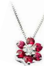
Art. CR70 Pendente Rub. ct. 0,25 Diam. ct. 0,02 Gold 18 kt gr. 1,20