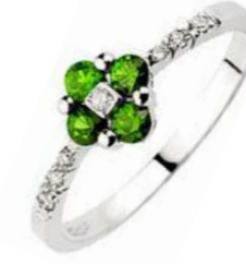
Art.AS60 Anello Sme. ct. 0,25 Diam. ct. 0,06 Gold 18 kt gr. 2,00