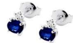
Art. OZ50 Orecchini Zaff.ct. 1,00 Diam.ct.0,06 Gold 18 kt. gr. 1,10