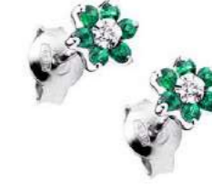
Art. OS70 Orecchini Sme. ct. 0,24 Diam. ct. 0,04 Gold 18 kt gr. 1,25