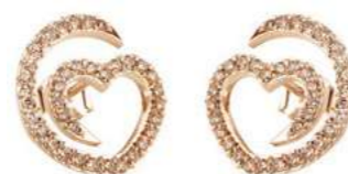
Art. ODB-300-1R Diam. brown ct.0.50 Gold 18 kt gr. 2.00