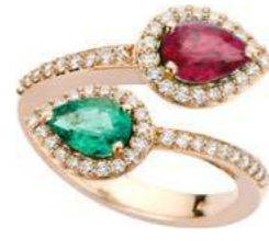
Art. ABRS 165-2R Sme.ct. 0.60 Rub.ct. 0,75 Diam.ct. 0.40 Gold 18 kt gr. 5,40