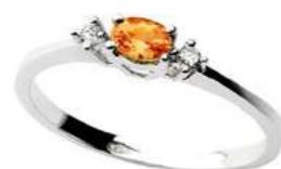
Art. AZO40 Zaff.Orange . ct. 0,23 Diam. ct. 0,03 Gold 18 kt. Gr. 1,50