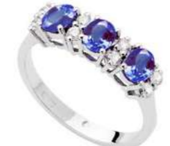
Art. AZ30-1 Anello Zaff. ct.1,45 Diam. ct.0,26 Gold 18 kt gr. 3,45