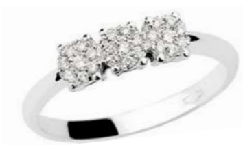
TGR78-2 Diam.ct.0,14 Gold 18 kt. gr. 1,85