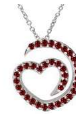
Art. CR-300-1 Rub. ct. 0.33 Gold 18 kt gr. 1.90