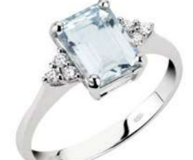
Art. AME860-3 Anello AM ct. 1.30 Diam. ct.0,09 Gold 18 kt. gr. 2,35