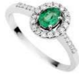
Art. AS34 Sme.ct.0,17 Diam. ct.0,15 Gold 18 kt gr. 2,30