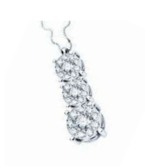
CDT78-112 Diam. centr. ct.0,15 Diam. ct. 0,22 Gold 18 kt. gr. 2,80