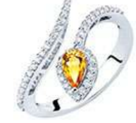
Art. ABZR-150-2 Zaff. Yellow ct.0,50 mm.6x4 Diam.ct.0.35 Gold 18 kt gr. 3,40