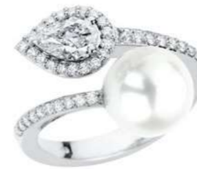
Art. ABP-166 Diam.Goccia ct.0.40 Perla mm.10/10.5 Diam.ct.0.30 Gold 18 kt gr. 4.80