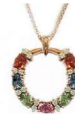
Art. CGZM-20R Zaf Mult. ct. 1,60 Diam. ct. 0,20 Gold 18 kt gr. 4,00