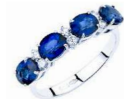
Art. AZ31 Anello Zaf. ct.2,00 Diam. ct.0,15 Gold 18 kt gr. 2,80