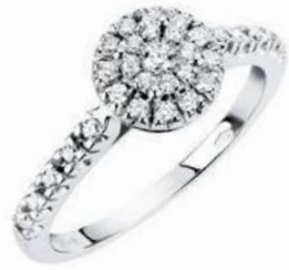
Art AD100 Diam. ct. 0,04 Diam. ct. 0,26 Gold 18 kt. gr. 3,00