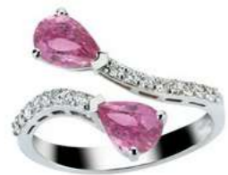
Art. ADZRC-59 Zaf rosa. ct. 1,70 Diam. ct.0.35 Gold 18 kt gr. 3.90