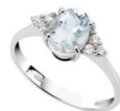
Art. AMO640-3 Anello AM ct. 0.40 Diam. ct.0,09 Gold 18 kt. gr. 2,10