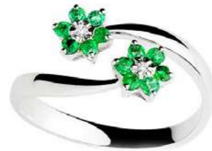
Art.AS70-1 Anello Sme. ct. 0,24 Diam. ct. 0,04 Gold 18 kt gr. 3,40