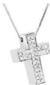
Art. CB 6156-1 Diam. ct.0.20 Gold 18 kt. gr. 2,70 Mis.cm. 1.60