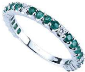
Art. FGSD 1519-20 Eternelle Sme. mm.2.00 ct. 0.80 Diam.ct. 0.12 Gold 18 kt. gr. 2.50