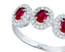
Art. TBR34 Rub. ct.0,60 Diam. ct.0,25 Gold 18 kt gr. 3,00