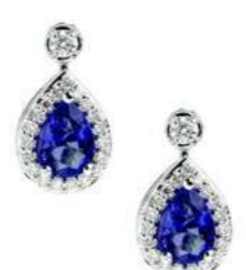
Art. OZD-166 Zaff.ct. 1.50 Diam.ct.0.38 Gold 18 kt gr. 3,00