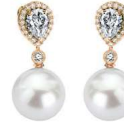
Art. OBP-166R Diam.Goccia ct.0,80 Perle mm. 13.00 Diamanti ct.0.34 Gold 18 kt gr. 3.50