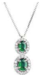
Art. C2DR-343 Sme. ct. 0,66 Diam. ct.0,30 Gold 18 kt gr. 2,30