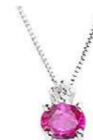
Art. CZR50 Pendente Zaff.Rosa ct.0,45 Diam.ct.0,03 Gold 18 kt. gr.1,10