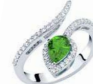
Art. ABS-150-1 Sme. ct.0,50 mm.7x5 Diam.ct.0.42 Gold 18 kt gr. 3,80