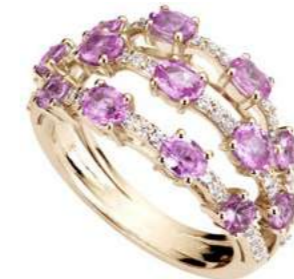
Art. ADZR 8713R Zaffiri rosa ct.2,20 Diam.ct.0,45. Gold 18 kt. gr. 6,00