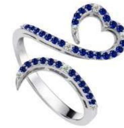
Art. ADZ-300-3 Zaf. ct. 0.36 Diam.ct. 0.07 Gold 18 kt gr. 3.50