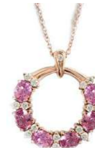
Art. CGZR-20R-1 Zaf Rosa ct. 1.50 Diam. ct. 0.18 Gold 18 kt. gr. 3,80