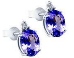
Art. OTNO750 Tanzanite ct.1.60 Diam. ct.0,04 Gold 18 kt. gr. 1,20