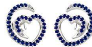
Art. ODZ-300-2 Zaf. ct. 0.64 Diam.ct.0.04 Gold 18 kt gr. 2.00