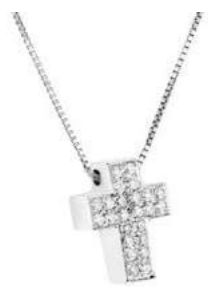
Art. CB 6155-1 Diam. ct.0.13 Gold 18 kt. gr. 1,75 Mis.cm. 1.10