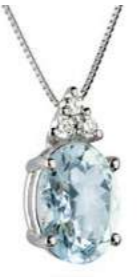
Art. CMO750-3 Pendente AM ct. 0.70 Diam. ct.0,045 Gold 18 kt. gr. 1,20