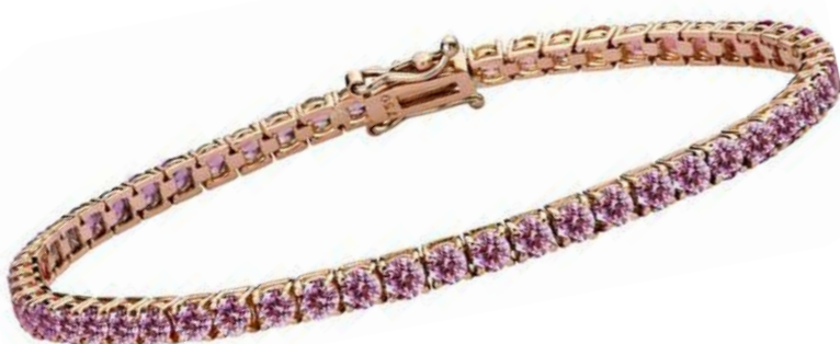
Art. BNZR 1519-25R Bracciale in oro rosa Zaffiri rosa mm.2.5 ct. 5,00 Gold 18 kt. gr. 8,00