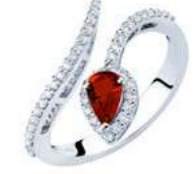
Art. ABR-150-2 Rub. ct.0,50 mm. 6x4 Diam.ct.0.35 Gold 18 kt gr. 3,40