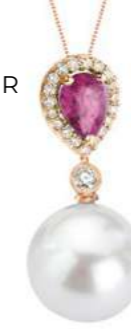
Art. CZRP-166R Zaff.Rosa ct. 0,80 Perla mm. 12.00 Diamanti ct.0.18 Gold kt.18 gr. 2,60