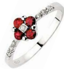
Art.AR60 Anello Rub. ct. 0,35 Diam. ct. 0,06 Gold 18 kt gr. 2,00