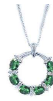
Art. CGS-20-1 Sme ct. 1.10 Diam. ct. 0.18 Gold 18 kt. gr. 3,80