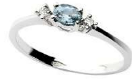
Art. AAM40 Acquam. ct. 0,15 Diam. ct. 0,03 Gold 18 kt. Gr. 1,50