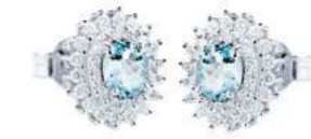
Art. OAM88 Orecchini AM. ct. 0,70 Diam. ct.0,60 Gold 18 kt gr. 2,80