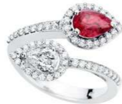
Art. ABR 166 Rub.ct.0.70 Diam. Goccia ct.0.40 Diam.ct.0.40 Gold 18 kt gr. 5,00