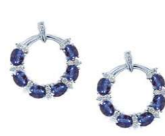
Art. OGZ-20-1 Zaf ct. 2.80 Diam. ct. 0.40 Gold 18 kt. gr. 6,00