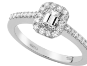
Art. ADE-370 Diam. Ottag. ct. 0,37 Diam.ct.0.35 Gold 18 kt gr. 3,90