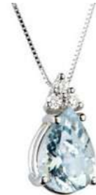
Art. CMG750-3 Pendente AM ct. 0.70 Diam. ct.0,045 Gold 18 kt. gr. 1,20