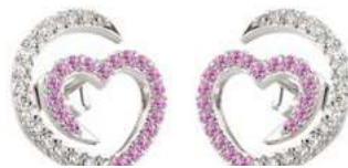
Art. ODZR-300-1 Zaf. rosa ct. 0.34 Diam.ct.0.24 Gold 18 kt gr. 2.00