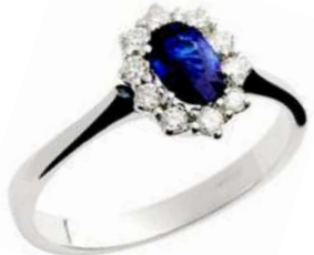
Art. AZ10 Anello Zaff. ct.0,55 Diam. ct.0,20 Gold 18 kt gr. 2,60