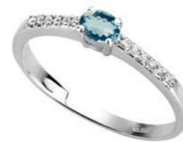
Art. AAM35-1 AM.ct.0,15 Diam.ct.0,10 Gold 18 kt. gr. 1,80