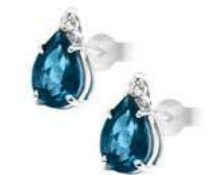
Art. OBLG750 Orecchini TBL ct. 1,90 Diam. ct.0,04 Gold 18 kt. gr. 1,05