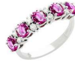
Art. AZR30-5 Anello Zaf. Rosa ct.2,40 Diam. ct.0,08 Gold 18 kt gr. 2,70

(PIETRE DI COLORE mm 5X4 DIAMANTI DA CT.0.01)