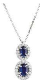
Art. C2DR-343 Zaff. ct. 0,75 Diam. ct.0,30 Gold 18 kt gr. 2,30