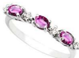
Art. TZR40 Zaff. Rosa ct. 0,70 Diam. ct. 0,06 Gold 18 kt. Gr. 1,80