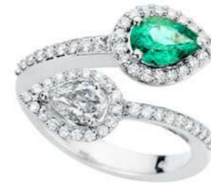
Art. ABS-170 Smeraldo ct.0.60 Diam.Goccia ct.0.44 Diam. ct.0.80 Gold 18 kt gr. 8,00