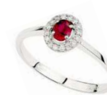
Art. AR43 Rub. ct.0,45 Diam. ct.0,18 Gold 18 kt gr. 2,50