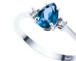
Art. ABLG860 Anello TBL ct. 1,15 Diam. ct.0,05 Gold 18 kt. gr. 2,20