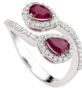
Art. ABRC-150-1 Rub. ct.1.50 mm.7x5 Diam.ct.0.55 Gold 18 kt gr. 4,90