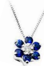
Art. CZ70 Pendente Zaff. ct.0,25 Diam. ct. 0,02 Gold 18 kt gr. 1,20