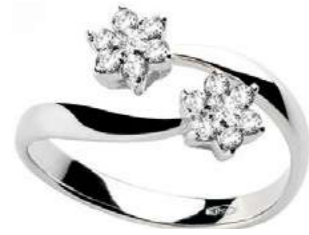
Art.AD70-1 Anello Diam. ct. 0,26 Gold 18 kt gr. 3,40