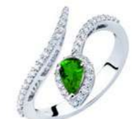
Art. ABS-150-2 Sme. ct.0,30 mm. 6x4 Diam.ct.0.35 Gold 18 kt gr. 3,40