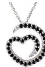
Art. CDN-300-2 Diam. neri. ct.0.35 Diam.ct.0.02 Gold 18 kt gr. 1.90