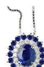
Art. CZ88Z Zaf. ct. 0,40 Zaf. ct. 0,20 Diam. ct.0,10 Gold 18 kt gr. 1,90