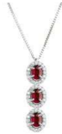
Art. CDTR34 Rub. ct. 0,75 Diam. ct.0,30 Gold 18 kt gr. 2,30