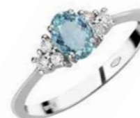
Art. AAM50-2 Anello AM ct.0,45 Diam.ct.0,15 Gold 18 kt. gr. 1,90