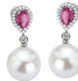
Art. OZRP-166 Zaff.Rosa ct. 1.60 Perle mm. 13.00 Diamanti ct.0.34 Gold 18 kt gr. 3.50