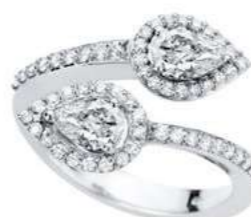
Art. ABD 166 2 Diam. Goccia ct.0.80 Diam.ct.0.40 Gold 18 kt gr. 5,00