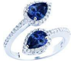
Art. ABZ-165-2 Zaff. ct.1,50 Diam.ct.0.40 Gold 18 kt. gr. 5,40