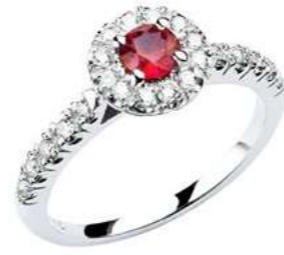
Art AR100 Rub. ct. 0.30 mm 4 Diam. ct. 0.20 Gold 18 kt. gr. 3,00