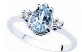
Art. AMG860 Anello AM ct. 1.10 Diam. ct.0,05 Gold 18 kt. gr. 2,20