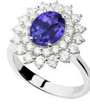
Art. ATN 8021-3 Tanzanite ct. 1.90 Diam. ct. 1.30 F-SI Gold 18 kt gr. 5.80