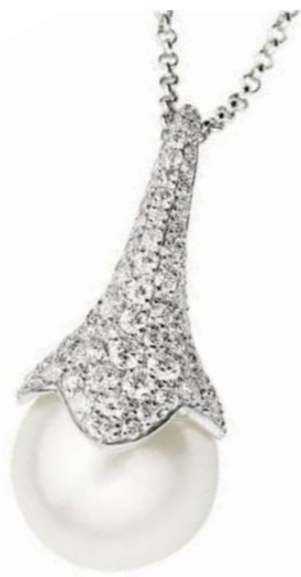
Art. CBP 8753 Perla Australia mm.15 Diam. ct. 1.41 Gold 18 kt gr. 7.50