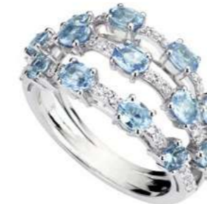
Art. ADAM 8713 Acquamarina ct.2,20 Diam.ct.0,45. Gold 18 kt. gr. 6,00