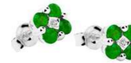
Art.OS60 Orecchini Sme. ct. 0,50 Diam. ct. 0,03 Gold 18 kt gr. 1,80