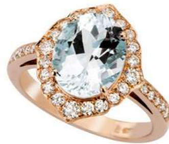
Art. AMM-911R Acquamarina ct.3.10 Diam.ct.0,70 Gold 18 kt gr. 5,80