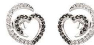
Art. ODN-300-1 Diam. neri. ct.0.34 Diam.ct.0.24 Gold 18 kt gr. 2.00