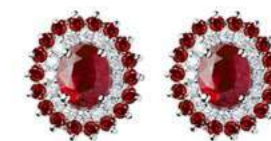
Art. OR88R Rub. ct. 0,80 Rub. ct. 0,40 Diam. ct.0,20 Gold 18 kt gr. 3,00