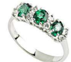
Art. AS30-1 Anello Sme. ct.1,00 Diam. ct.0,26 Gold 18 kt gr. 3,45