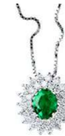
Art. CS88 Pendente Sme. ct. 0,33 Diam. ct.0,30 Gold 18 kt gr. 1,90