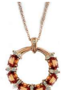
Art. CGZO-20R-1 Zaf Orange ct. 1.50 Diam. ct. 0.18 Gold 18 kt. gr. 3,80