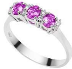
Art. AZR25-1 Anello Zaf. Rosa ct.0,70 Diam. ct.0,12 Gold 18 kt gr. 2,50

(PIETRE DI COLORE mm 3X4 DIAMANTI DA CT.0.015)