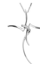
Art. CRO305 Diam. ct. 0,03 Gold 18 kt. gr. 1,50 Mis.cm. 3,00