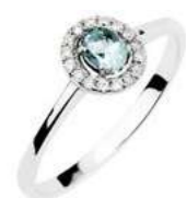
Art. AAM34-1 AM. ct.0,15 Diam. ct.0,10 Gold 18 kt gr. 1,80