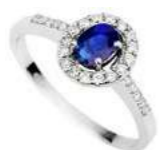
Art. AZ34 Zaff.ct.0,25 Diam. ct.0,15 Gold 18 kt gr. 2,30