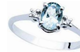
Art. AMO750 Anello AM ct. 0.60 Diam. ct.0,04 Gold 18 kt. gr. 1,90