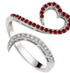
Art. ADR-300-1 Rub. ct. 0.30 Diam.ct.0.12 Gold 18 kt gr. 3.50