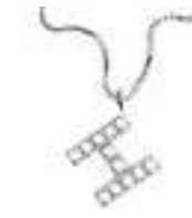
Art. CD900-H LETTERINA "H" Diam. ct.0.05 Gold 18 kt. gr. 1,40