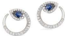
Art. OZD-155 Zaff. ct. 0,90 mm.6x4 Diam.ct. 0,60 Gold 18 kt. gr. 4,80