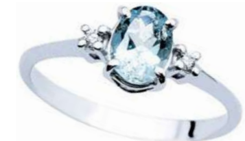
Art. AMO911 Anello AM ct. 2.80 Diam. ct.0,06 Gold 18 kt. gr. 2,30