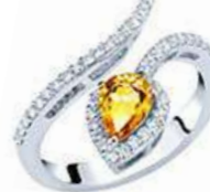
Art. ABZY-150-1 Zaff. Yellow ct.0,80 mm.7x5 Diam.ct.0.42 Gold 18 kt gr. 3,80