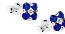
Art.OZ60 Orecchini Zaff. ct. 0,70 Diam. ct. 0,03 Gold 18 kt gr. 1,80