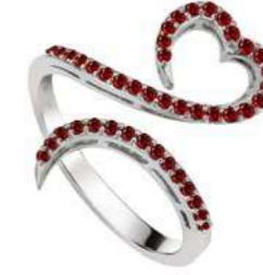
Art. AR-300-1 Rub. ct. 0.45 Gold 18 kt gr. 3.50