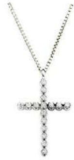
Art. CRO282 16 Diam. ct.0.15 Gold 18 kt. gr. 1,50 2,0x1,5 cm