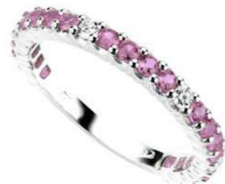
Art. FGZRD 1519-20 Eternelle Zaff.rosa mm.2.00 ct. 0.85 Diam.ct. 0.12 Gold 18 kt. gr. 2.50

Bei Roségold und Gelbgold sind die Kosten identisch.