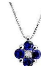
Art.CZ60 Pendente Zaff. ct. 0,35 Diam. ct. 0,01 Gold 18 kt gr. 1,45