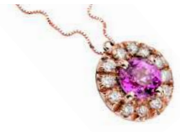
Art. CZR100-R Zaff.Rosa ct.0,50 mm 4 Diam.ct.0,12 Gold 18 kt. gr. 2,30