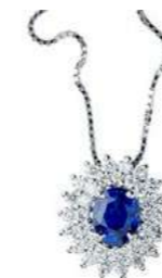
Art. CZ88 Pendente Zaff. ct. 0,48 Diam. ct.0,30 Gold 18 kt gr. 1,90