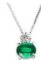
Art. CS50 Pendente Sme. ct.0,35 Diam.ct.0,03 Gold 18 kt. gr. 1,10