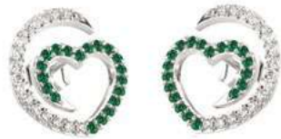
Art. ODS-300-1 Sme. ct. 0.34 Diam.ct.0.24 Gold 18 kt gr. 2.00