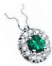
Art CS100 Sme.ct. 0.25 mm 4 Diam. ct. 0.12 Gold 18 kt. gr. 2,00