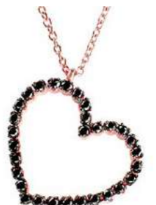
Art. CDB753 30 Black Diam.ct.0.33 Gold 18 kt.3.30