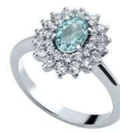
Art. AAM88 Anello AM. ct. 0,35 Diam. ct.0,30 Gold 18 kt gr. 2,80