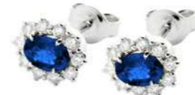
Art. OZ10 Orecchini Zaff.ct.1,10 Diam. ct.0,40 Gold 18 kt gr. 2,90