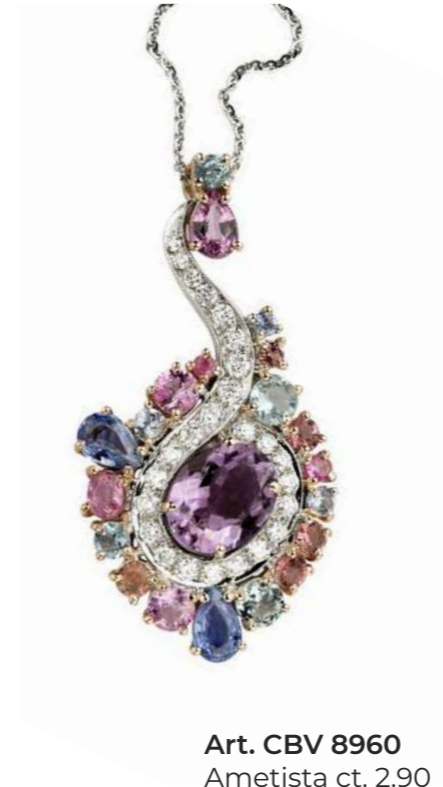
Art. CBV 8960 Ametista ct. 2.90 Zaffiro ct. 3.15 Acquamarina ct. 0.55 Diam. ct. 0.63 F-SI Gold 18 kt gr. 10.00