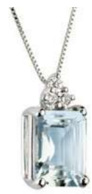
Art. CME640-3 Pendente AM ct. 0.40 Diam. ct.0,045 Gold 18 kt. gr. 1,20