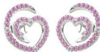
Art. ODZR-300-3 Zaf. rosa ct. 0.56 Diam.ct.0.08 Gold 18 kt gr. 2.00