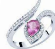
Art. ABZR-150-1 Zaff. Rosa ct.0,75 mm.7x5 Diam.ct.0.42 Gold 18 kt gr. 3,80