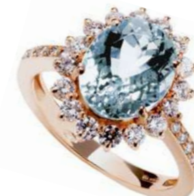
Art. AMM-119R Acquamarina ct. 3,10 mm.11x9 Diam. ct.0,90 Gold 18 kt. gr. 5,50