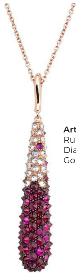
Art. CBR 8801 Rubini ct. 7.40 Diam. ct. 1,18 F-SI Gold 18 kt gr. 7.00