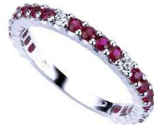
Art. FGRD 1519-20 Eternelle Rub. mm.2.00 ct. 0.80 Diam.ct. 0.12 Gold 18 kt. gr. 2.50