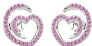
Art. ODZR-300-2 Zaf. rosa ct. 0.64 Diam.ct.0.04 Gold 18 kt gr. 2.00