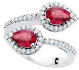
Art. ABR-165-2 Rub. ct. 1,50 Diam.ct.0.40 Gold 18 kt. gr. 5,40