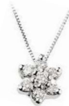
Art. CD70 Pendente Diam. ct. 0,14 g Gold 18 kt r. 1,20