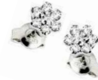
Art. OD70 Orecchini Diam. ct. 0,28 Gold 18 kt gr. 1,25