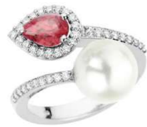
Art. ARP-166 Rub. ct.0.70 Perla mm. 12.00 Diamanti ct.0.18 Gold 18 kt gr. 4,80