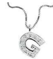
Art. CD900-G LETTERINA "G" Diam. ct.0.03 Gold 18 kt. gr. 1,37