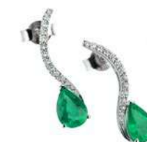
Art. ODS-59 Sme. ct. 1,20 Diam. ct.0.20 Gold 18 kt gr. 2.00