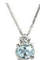
Art. CAM50 Pendente AM ct.0,30 Diam.ct.0,03 Gold 18 kt. gr.1,10