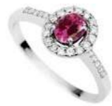
Art. AZR34 Zaff.Rosa ct.0,30 Diam. ct.0,15 Gold 18 kt gr. 2,30