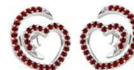
Art. ODR-300-2 Rub. ct. 0.64 Diam.ct. 0.04 Gold 18 kt gr. 2.00