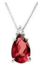
Art. CRG750 Rubino ct.0,75 Diam. ct.0,02 Gold 18 kt. gr. 1,10