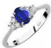
Art. AZ50-1 Anello Zaff. ct.0,60 Diam.ct.0,20 Gold 18 kt. gr.3,40