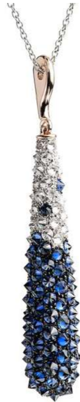
Art. CBZ 8800-2 Zaffiri ct. 4.00 Diam. ct. 2.80 F-SI Gold 18 kt gr. 7.50