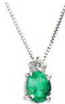
Art. CS50/1 Pendente Sme. ct.0,35 Diam. ct.0,03 Gold 18 kt gr. 1,10