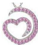
Art. CDZR-300-2 Zaf. rosa ct. 0.32 Diam.ct.0.02 Gold 18 kt gr. 1.90