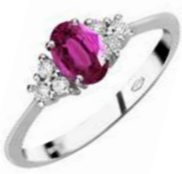
Art. AZR50-1 Anello Zaf.Rosa ct.0,55 Diam.ct.0,20 Gold 18 kt. gr. 3,40