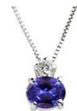
Art. CTN50 Pendente Tanzanite ct.0,35 Diam.ct.0,03 Gold 18 kt. gr.1,10