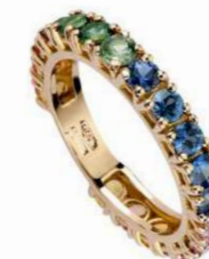
Art. FGM-30/ FGM-30R Eternelle Oro Bianco e Oro Rosa Zaffiri Multicolor mm. 3.0 ct 2,70 Gold 18 kt. gr. 2.55