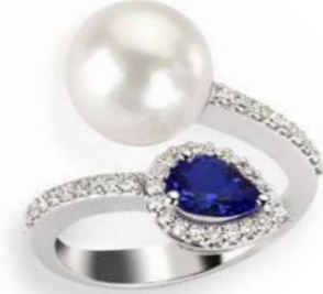
Art. AZP-166 Zaff. ct.0.75 Perla mm.10/10.5 Diam.ct.0.30 Gold 18 kt gr. 4.80