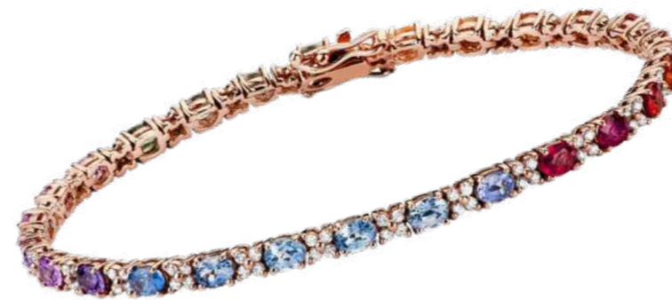
Art. BZV30-25 Bracciale Oro Bianco Zaffiri Multicolor ct. 5,80 Diam. ct.0,65 Gold 18 kt gr. 10,00