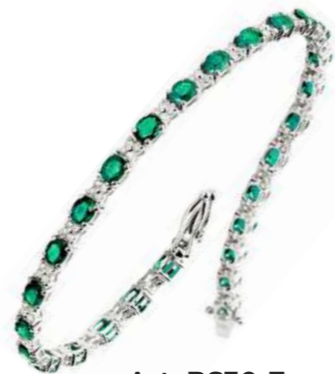
Art. BS30-7 Bracciale Sme. ct.4.60 Diam. ct.0.86 Gold 18 kt gr. 11,00