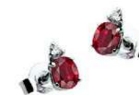
Art. OR40 Rub. ct. 0,50 Diam. ct. 0,03 Gold 18 kt. Gr. 0,90