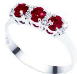
Art. AR25-1 Anello Rub. ct.0,60 Diam. ct.0,12 Gold 18 kt gr. 2,50