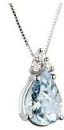
Art. CMG640-3 Pendente AM ct. 0.35 Diam. ct.0,045 Gold 18 kt. gr. 1,05