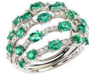
Art. ADS 8723 Smeraldi ct. 3,00 Diam.ct.0,65 Gold 18 kt. gr. 11,00