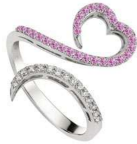
Art. ADZR-300-1 Zaf. rosa ct. 0.30 Diam.ct.0.12 Gold 18 kt gr. 3.50