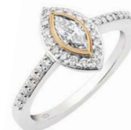
Art. ADN-340WR Diam. Nav. ct. 0,34 Diam.ct.0.30 Gold 18 kt gr. 3,90