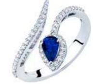
Art. ABZ-150-2 Zaff. ct.0,50 mm.6x4 Diam.ct.0.35 Gold 18 kt gr. 3,40