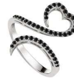
Art. AN-300-1 Diam. neri. ct.0.45 Gold 18 kt gr. 3.50