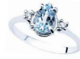
Art. AMG640L Anello AM ct. 0.35 Diam. ct.0,03 Gold 18 kt. gr. 1,50