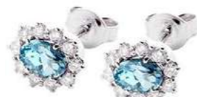
Art. OAM10 Orecchini AM. ct. 0,90 Diam. ct.0,40 gr. 2,90