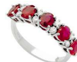
Art. AR30 Anello Rub. ct.2.35 Diam. ct.0,26 Gold 18 kt gr. 3,90