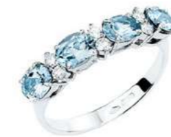
Art. AAM31 Anello AM.ct.1,30 Diam. ct.0,15 Gold 18 kt gr. 2,80