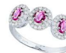
Art. TBZR34 Zaff.Rosa ct.0,70 Diam. ct.0,25 Gold 18 kt gr. 3,00