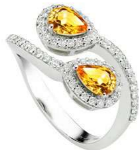
Art. ABZYC-150-1 Zaff. Rosa ct.1,50 mm.7x5 Diam.ct.0,55 Gold 18 kt gr. 4,90