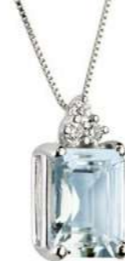
Art. CME860-3 Pendente AM ct. 1.30 Diam. ct.0,045 Gold 18 kt. gr. 1,30