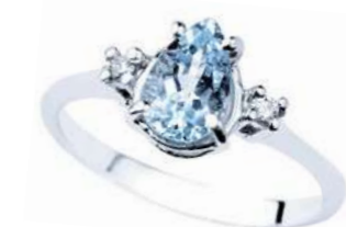
Art. AMG860L Anello AM ct. 1.10 Diam. ct.0,05 Gold 18 kt. gr. 2,20