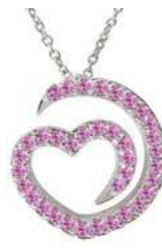
Art. CZR-300-1 Zaf. rosa ct. 0.38 Gold 18 kt gr. 1.90