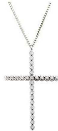
Art. CRO284 26 Diam. ct.0.25 Gold 18 kt. gr. 2,50 3,0x2,0 cm