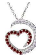
Art. CDR-300-1 Rub. ct. 0.17 Diam.ct.0.12 Gold 18 kt gr. 1.90