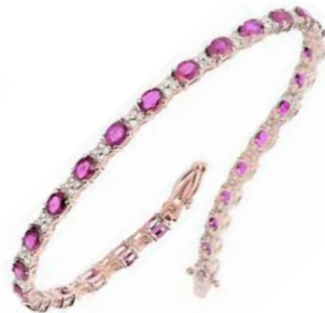
Art. BZR30-7R Bracciale Zaf. Rosa ct.6.00 Diam. ct.0.86 Gold 18 kt gr. 11,00