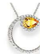
Art. CZYD-155 Zaff. Yellow ct.0,80 mm.7x5 Diam.ct. 0,50 Gold 18 kt. gr. 3,30