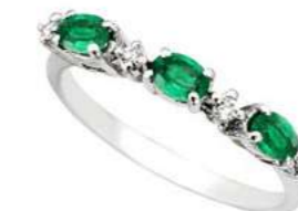
Art. TS40 Sme. ct. 0,40 Diam. ct. 0,06 Gold 18 kt. Gr. 1,80