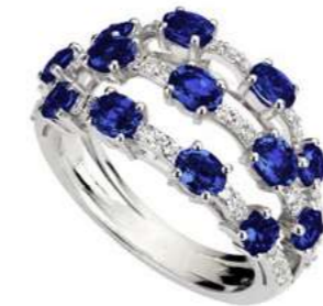
Art. ADZ 8713 Zaffiri ct.2,20 Diam.ct.0,45. Gold 18 kt. gr. 6,00