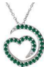
Art. CDS-300-2 Sme. ct. 0.26 Diam.ct.0.02 Gold 18 kt gr. 1.90