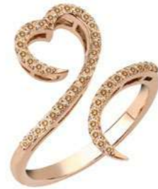
Art. ADB-300-1R Diam. brown ct. 0.36 Gold 18 kt gr. 3.50