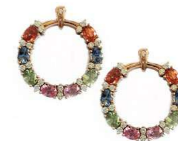
Art. OGZM-25R Zaf Mult. ct. 4,00 Diam. ct. 0,45 Gold 18 kt gr. 9,00