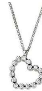
Art. CD750 16 Diam.ct.0.16 Gold 18 kt. 1.90