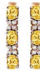
Art. ODZY-31 Zaf yellow ct.1.40 Diam.ct.0.20 Gold 18 kt gr. 2,00