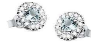
Art. OAM100 AM.ct.0,50 mm 4 Diam.ct.0,24 Gold 18 kt. gr. 2,70