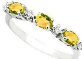
Art. TZG40 Zaff. Yellow ct. 0,70 Diam. ct. 0,06 Gold 18 kt. Gr. 1,80