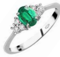
Art. AS50-1 Anello Sme. ct.0,50 Diam.ct.0,20 Gold 18 kt. gr.3,40