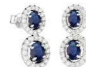
Art. O2DZ-343 Zaff.ct. 1,50 Diam. ct.0,60 Gold 18 kt gr. 3,30