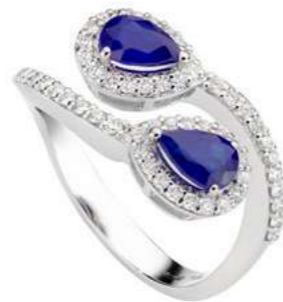
Art. ABZC-150-1 Zaff. ct.1.50 mm.7x5 Diam.ct.0.55 Gold 18 kt gr. 4,90