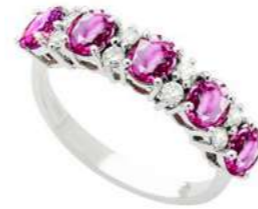
Art. AZR30 Anello Zaf. Rosa ct.2,40 Diam. ct.0,26 Gold 18 kt gr. 3,90