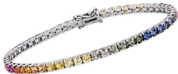
Art. BNZM 1519-25 Bracciale Oro Bianco Zaffiri Multicolor mm. 2.5 ct. 5,00 Gold 18 kt. gr. 8,00