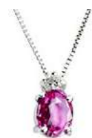
Art. CZR50/1 Pendente Zaff.Rosa ct. 0,45 Diam. ct.0,03 Gold 18 kt gr. 1,10