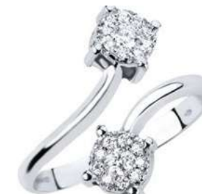
ADC77-3 Diam.ct.0,38 Gold 18 kt. gr. 4,50