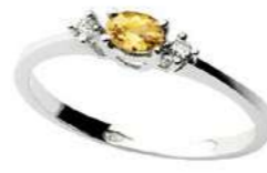
Art. AZG40 Zaff.Yellow . ct. 0,23 Diam. ct. 0,03 Gold 18 kt. Gr. 1,50