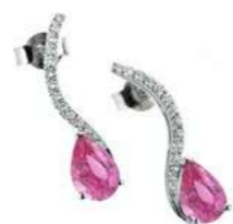
Art. ODZR-59 Zaf rosa. ct. 1,70 Diam. ct.0.20 Gold 18 kt gr. 2.00