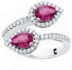
Art. ABZR-165-2 Zaff.Rosa ct.1,50 Diam.ct.0.40 Gold 18 kt gr. 5,40