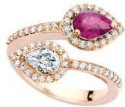
Art. AZR-166R Zaf. Rosa ct.0.80 Diam.Goccia ct.0.40 Diam.ct.0.40 Gold 18 kt. gr. 5.00