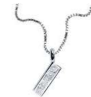
Art. CD900-I LETTERINA "I" Diam. ct.0.015 Gold 18 kt. gr. 1,07