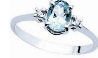
Art. AMO860L Anello AM ct. 1.00 Diam. ct.0,05 Gold 18 kt. gr. 2,30