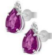
Art. OZRG750 Zaffiro Rosa ct.1.60 Diam. ct.0,04 Gold 18 kt. gr. 1,20