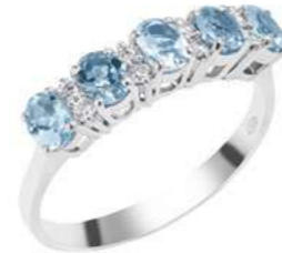
Art. AAM25 Anello AM.ct.0,75 Diam. ct.0,12 Gold 18 kt gr. 2,70