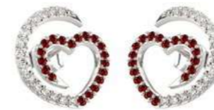
Art. ODR-300-1 Rub. ct. 0.34 Diam.ct.0.24 Gold 18 kt gr. 2.00