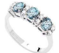
Art. AAM30-1 Anello AM ct. 0,90 Diam. ct.0,26 Gold 18 kt gr. 3,45