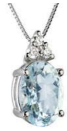
Art. CMO860-3 Pendente AM ct. 1,00 Diam. ct.0,045 Gold 18 kt. gr. 1,25