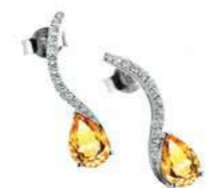
Art. ODZY-59 Zaf yellow. ct. 1,20 Diam. ct.0.20 Gold 18 kt gr. 2.00