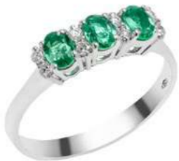
Art. AS25-1 Anello Sme. ct.0,50 Diam. ct.0,12 Gold 18 kt gr. 2,50