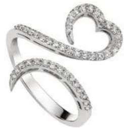
Art. AD-300-1 Diam. ct. 0.35 Gold 18 kt gr. 3.50