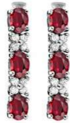
Art. ODR-31 Rub. ct.1.40 Diam.ct.0.20 Gold 18 kt gr. 2,00