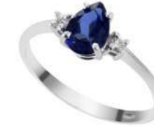
Art. ATNG750 Tanzanite ct.0,80 Diam. ct.0,04 Gold 18 kt. gr. 2,10