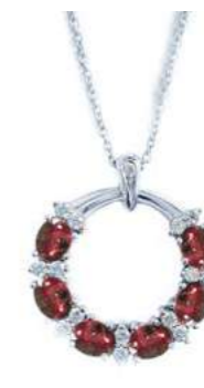
Art. CGR-20-1 Rub . ct. 1.30 Diam. ct. 0.18 Gold 18 kt. gr. 3,80