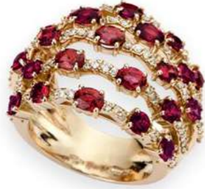
Art. ADR 8723R Rubini ct.3,60 Diam.ct.0,65. Gold 18 kt. gr. 11,00