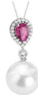
Art. CZRP-166 Zaff.Rosa ct. 0,80 Perla mm. 12.00 Diamanti ct.0.18 Gold kt.18 gr. 2,60