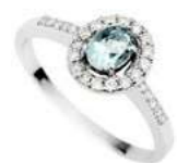
Art. AAM34 AM. ct.0,15 Diam. ct.0,15 Gold 18 kt gr. 2,30