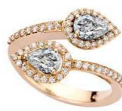
Art. ABD 166R 2 Diam. Goccia ct.0.80 Diam.ct.0.40 Gold 18 kt gr. 5,00