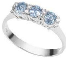
Art. AAM25-1 Anello AM.ct.0,45 Diam. ct.0,12 Gold 18 kt gr. 2,50