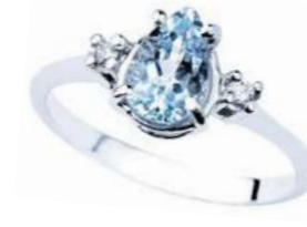
Art. AMG640 Anello AM ct. 0.35 Diam. ct.0,03 Gold 18 kt. gr. 1,50