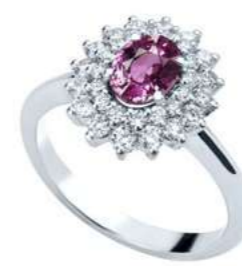
Art. AZR88 Anello Zaff. Rosa ct. 0,48 Diam. ct.0,30 Gold 18 kt gr. 2,80