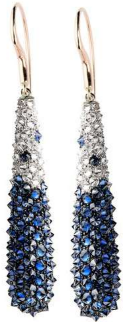
Art. OBZ 8800-2 Zaffiri ct. 8.00 Diam. ct. 5.40 F-SI Gold 18 kt gr. 12.00