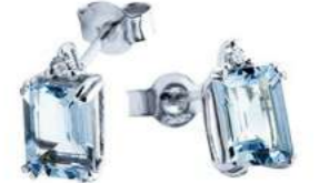
Art. OME860 Orecchini AM ct. 2,50 Diam. ct.0,05 Gold 18 kt. gr. 1,55