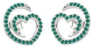
Art. ODS-300-2 Sme. ct. 0.50 Diam.ct.0.04 Gold 18 kt gr. 2.00