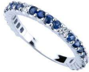
Art. FGZD 1519-20 Eternelle Zaff. mm.2.00 ct. 0.80 Diam.ct. 0.12 Gold 18 kt. gr. 2.50