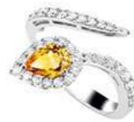
Art. ABZY-150 Zaff. Yellow ct.0,80 mm.7x5 Diam.ct.0.60 Gold 18 kt gr. 4,70