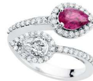
Art. ABR-170 Rub. ct. 0.75 1 Diam.Goccia ct.0.44 Diam.ct. 0.80 Gold 18 kt. gr. 8.00