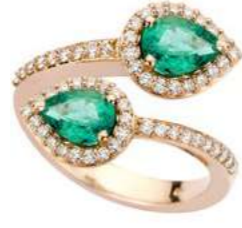
Art. ABS 165-2R 2 Sme. ct. 1.20 Diam. ct.0.40 Gold 18 kt. gr. . 5.40