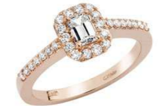
Art. ADE-370R Diam. Ottag. ct. 0,37 Diam.ct.0.35 Gold 18 kt gr. 3,90