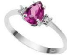
Art. AZRG750 Zaffiro Rosa ct.0,80 Diam. ct.0,04 Gold 18 kt. gr. 2,10