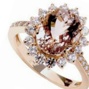
Art. AMR-119R Morganite ct. 3,10 mm.11x9 Diam. ct.0,90 Gold 18 kt. gr. 5,50