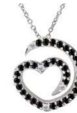
Art. CDN-300-3 Diam. neri. ct.0.32 Diam.ct.0.04 Gold 18 kt gr. 1.90