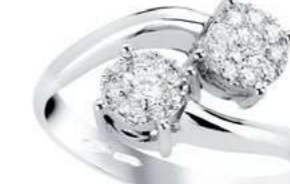
ADC78-2 Diam.ct.0,26 Gold 18 kt. gr. 3,80