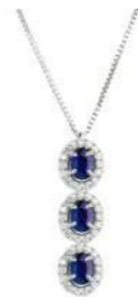
Art. CDTZ34 Zaff. ct. 0,75 Diam. ct.0,30 Gold 18 kt gr. 2,30