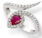
Art. ABR-155 Art. ABR-155-1 Rub. ct. 0,50 Rub. ct. 0,75 mm.6x4 mm.7x5 Diam.ct. 0,42 Diam.ct. 0,42 Gold 18 kt. gr. 4,50 Gold 18 kt. gr. 5,50