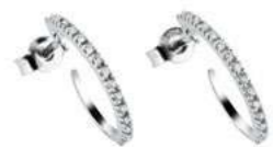
Art. OD80-120 Diam. ct.0,10 Gold 18 kt. gr. 1,20