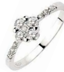
Art.AD60 Anello Diam. ct. 0,33 Diam. ct. 0,06 Gold 18 kt gr. 2,00