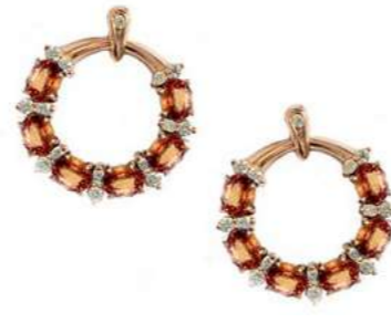
Art. OGZO-20R-1 Zaf Orange ct. 3.00 Diam. ct. 0.40 Gold 18 kt. gr. 6,00