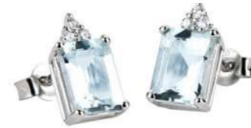
Art. OME640-3 Orecchini AM ct. 0.80 Diam. ct.0,09 Gold 18 kt. gr. 1,50