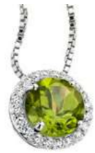
Art. CPT 160 Peridoto Diam.ct.0,11 Gold 18 kt. gr. 1,75