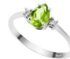
Art. APDG750 PeriDiam. ct.0,70 Diam.ct.0,04 Gold 18 kt. Gr.2,10