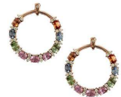
Art. OGZM-30R Zaf Mult. ct. 5,00 Diam. ct. 0,55 Gold 18 kt gr. 10,00