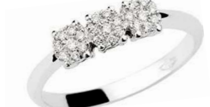
TGR78-3 Diam.ct.0,17 Gold 18 kt. gr. 1,90