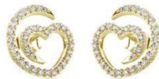
Art. OD-300-1G Diam.ct.0.50 Gold 18 kt gr. 2.00