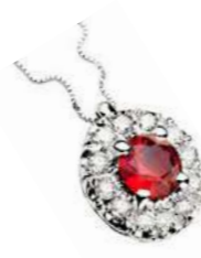
Art CR100 Rub.ct. 0.30 mm 4 Diam. ct. 0.12 Gold 18 kt. gr. 2,00