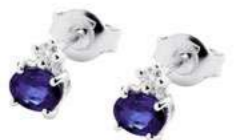
Art. OTN50 Orecchini Tanzanite ct.0,70 Diam.ct.0,06 Gold 18 kt. gr. 1,10