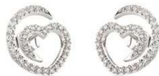
Art. OD-300-1 Diam.ct.0.50 Gold 18 kt gr. 2.00