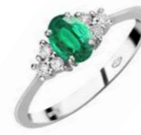
Art. AS50-2 Anello Sme. ct.0,50 Diam.ct.0,15 Gold 18 kt. gr. 1,90