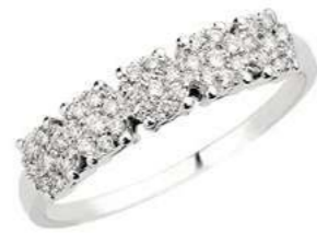
FGR78-2 Diam.ct.0,25 Gold 18 kt. gr. 2,30