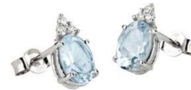
Art. OMO640-3 Orecchini AM ct. 0.85 Diam. ct.0,09 Gold 18 kt. gr. 1,35