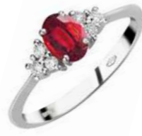
Art. AR50-1 Anello Rub. ct.0,65 Diam.ct.0,20 Gold 18 kt. gr.3,40