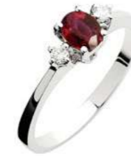
Art. AR50 Anello Rub. ct.0,50 Diam.ct.0,06 Gold 18 kt. gr. 2,10