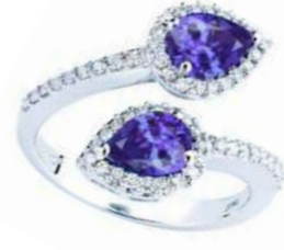
Art. ABTN 165-2 Tanzaniti ct. 1,50 Diam.ct. 0.40 Gold 18 kt gr. 5,40