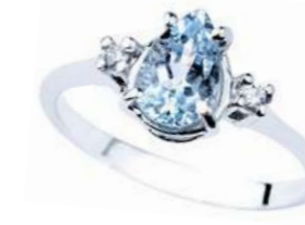
Art. AMG750L Anello AM ct. 0.60 Diam. ct.0,04 Gold 18 kt. gr. 1,90