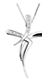
Art. CRO307 Diam. ct. 0,045 Gold 18 kt. gr. 1,95 Mis.cm. 3,00