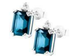
Art. OBLE860 Orecchini TBL ct. 3,90 Diam. ct.0,05 Gold 18 kt. gr. 1,55