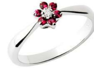
Art. AR70 Anello Rub. ct. 0,25 Diam. ct. 0,02 Gold 18 kt gr. 2,30