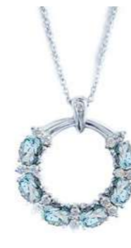
Art. CGAM-20-1 Acq. ct. 1.10 Diam. ct. 0.18 Gold 18 kt. gr. 3,80