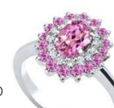
Art. AZR88ZR Zaf rosa. ct. 0,40 Zaf rosa. ct. 0,20 Diam. ct.0,10 Gold 18 kt gr. 2,80