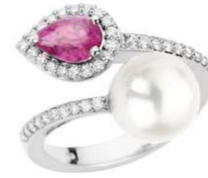
Art. AZRP-166 Zaff.Rosa ct.0.80 Perla mm.10/10.5 Diam.ct.0.30 Gold 18 kt gr. 4.80