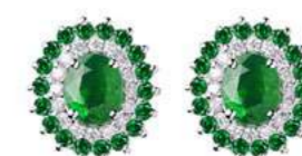
Art. OS88S Sme. ct. 0,66 Sme. ct. 0,40 Diam. ct.0,20 Gold 18 kt gr. 3,00