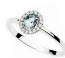
Art. AAM43 AM. ct.0,35 Diam. ct.0,18 Gold 18 kt gr. 2,50