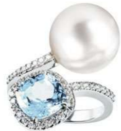
Art. AAMP-8 Perla mm.11/11.5 Acquam.ct. 2,00 Diam.ct.0.45 Gold 18 kt gr. 5.15