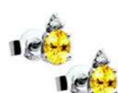
Art. OZG40 Zaff.Yellow . ct. 0,23 Diam. ct. 0,03 Gold 18 kt. Gr. 0,90