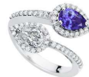
Art. ABTN-170 Tanzanite ct. 0.75 1 Diam.Goccia ct.0.44 Diam.ct. 0.80 Gold 18 kt. gr. 8.00

Die Diamanten im Birnenschliff weisen die Qualität F - VS auf