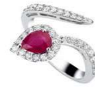
Art. ABR-150 Rub. ct.0,75 mm. 7x5 Diam.ct.0.60 Gold 18 kt gr. 4,70