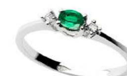
Art. AS40 Sme. ct. 0,17 Diam. ct. 0,03 Gold 18 kt. Gr. 1,50