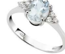
Art. AMO750-3 Anello AM ct. 0.60 Diam. ct.0,09 Gold 18 kt. gr. 2,15