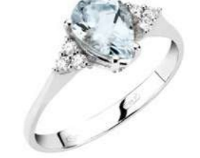
Art. AMG860-3 Anello AM ct. 1.10 Diam. ct.0,09 Gold 18 kt. gr. 2,30