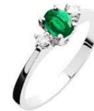
Art. AS50 Anello Sme. ct.0,33 Diam.ct.0,06 Gold 18 kt. gr. 2,10