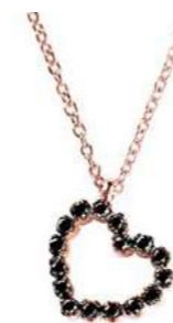
Art. CDB750 16 Black Diam.ct.0.18 Gold 18 kt. 1.95

Cuori Oro rosa e Diamanti neri Rolo chain