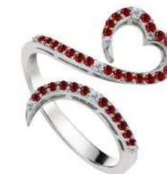
Art. ADR-300-3 Rub. ct. 0.36 Diam.ct. 0.07 Gold 18 kt gr. 3.50