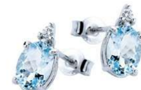
Art. OMO911 Orecchini AM ct. 6.30 Diam. ct.0,06 Gold 18 kt. gr. 2.30