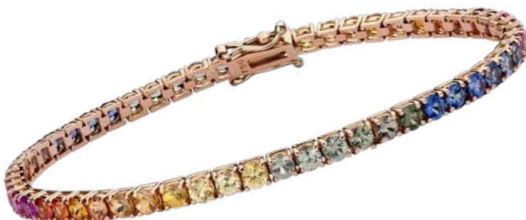
Art. BNZM 1519-25R Bracciale Oro Rosa Zaffiri Multicolor mm. 2.5 ct. 5,00 Gold 18 kt. gr. 8,00