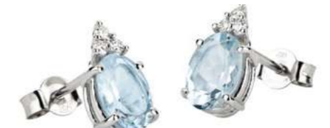
Art. OMO860-3 Orecchini AM ct.2,00 Diam. ct.0,09 Gold 18 kt. gr. 1,60