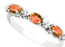
Art. TZO40 Zaff Orange. ct. 0,45 Diam. ct. 0,05 Gold 18 kt. Gr. 1,80