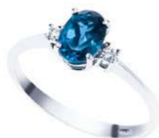
Art. ABLO970 Anello TBL ct. 2.15 Diam. ct.0,05 Gold 18 kt. gr. 2,70