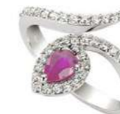
Art. ABZR-155 Art. ABZR-155-1 Zaff. Rosa ct. 0,50 Zaff. Rosa ct. 0,80 mm.6x4 mm.7x5 Diam.ct. 0,42 Diam.ct. 0,50 Gold 18 kt. gr. 4,50 Gold 18 kt. gr. 5,50