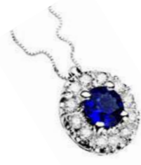
Art CZ100 Zaff.ct. 0.30 mm 4 Diam. ct. 0.12 Gold 18 kt. gr. 2,00