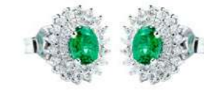
Art. OS88 Orecchini Sme. ct. 0,66 Diam. ct.0,60 Gold 18 kt gr. 2,80