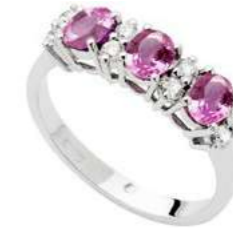
Art. AZR30-3 Anello Zaf. Rosa ct.1,20 Diam. ct.0,08 Gold 18 kt gr. 2,45