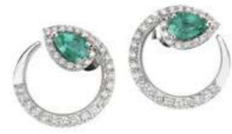
Art. OSD-155 Sme. ct. 0,65 mm.6x4 Diam.ct. 0,60 Gold 18 kt. gr. 4,80