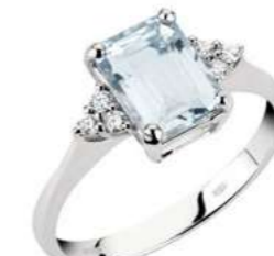
Art. AME750-3 Anello AM ct. 0.90 Diam. ct.0,09 Gold 18 kt. gr. 2,30