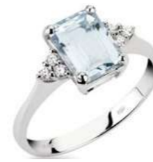
Art. AME640-3 Anello AM ct. 0.40 Diam. ct.0,09 Gold 18 kt. gr. 2,20