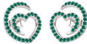
Art. OS-300-1 Sme. ct. 0.52 Gold 18 kt gr. 2.00