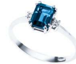
Art. ABLE750 Anello TBL ct. 1,40 Diam. ct.0,04 Gold 18 kt. gr. 1,80