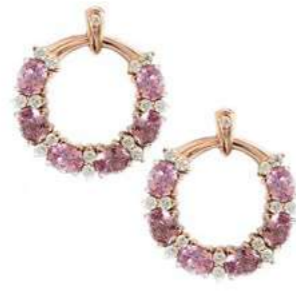
Art. OGZR-20R-1 Zaf Rosa ct. 3.00 Diam. ct. 0.40 Gold 18 kt. gr. 6,00