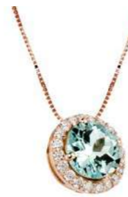
Art. CAM 160R Acquamarina ct. 0.70 Diam.ct.0,11 Gold 18 kt. gr. 2.10