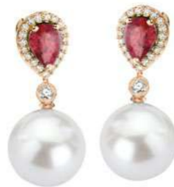
RUB. ct.1.40 Perle mm. 12.00 Diamanti ct.0.36 Gold 18 kt gr. 3,50