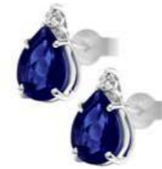
Art. OZG750 Zaffiro ct.1.60 Diam. ct.0,04 Gold 18 kt. gr. 1,20