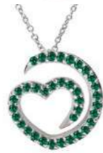
Art. CS-300-1 Sme. ct. 0.28 Gold 18 kt gr. 3.50