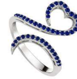
Art. AZ-300-1 Zaf. ct. 0.45 Gold 18 kt gr. 3.50