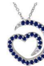
Art. CDZ-300-2 Zaf. ct. 0.32 Diam.ct.0.02 Gold 18 kt gr. 1.90