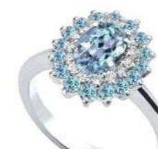
Art. AAM88AM Acq.ct. 0,30 Acq. ct. 0,20 Diam. ct.0,10 Gold 18 kt gr. 2,80