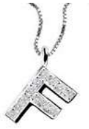
Art. CD900-F LETTERINA "F" Diam. ct.0.04 Gold 18 kt. gr. 1,35