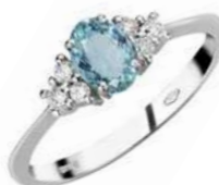
Art. AAM50-1 Anello AM ct.0,45 Diam.ct.0,20 Gold 18 kt. gr. 3,40