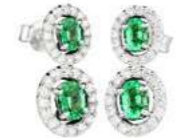
Art. O2DS-343 Sme. ct. 1,32 Diam. ct.0,60 Gold 18 kt gr. 3,30