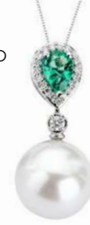
Art. CSP-166 Smeraldo ct.0.60 Perla mm.12.00 Diam.ct.0.18 Gold 18 kt gr. 2,60