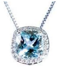
Art. CAM-8-1 Acquam.ct. 2,00 Diam. ct.0.20 Gold 18 kt gr. 2.70