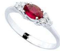
Art. AR51-1 Anello Rub ct. 0,60 Diam. ct.0,11 Gold 18 kt gr. 2,20