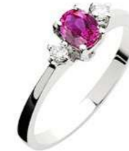
Art. AZR50 Anello Zaff.Rosa ct.0,45 Diam.ct.0,06 Gold 18 kt. gr. 2,10