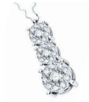
CDT78-223 Diam. centr. ct.0,26 Diam. ct. 0,36 Gold 18 kt. gr. 3,80