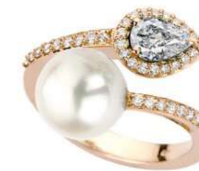
Art. ABP-166R Diam.Goccia ct.0.40 Perla mm.10/10.5 Diam.ct.0.30 Gold 18 kt gr. 4.80