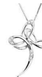
Art. CRO308 Diam. ct. 0,045 Gold 18 kt. gr. 2,40 Mis.cm. 2,80