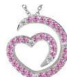
Art. CDZR-300-3 Zaf. rosa ct. 0.28 Diam.ct.0.04 Gold 18 kt gr. 1.90