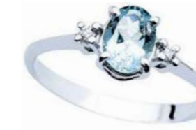
Art. AMO750L Anello AM ct. 0.60 Diam. ct.0,04 Gold 18 kt. gr. 1,90