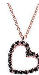
Art. CDB751 20 Black Diam.ct.0.22 Gold 18 kt.2.15