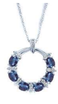
Art. CGZ-20-1 Zaf. ct. 1.40 Diam. ct. 0.18 Gold 18 kt. gr. 3,80