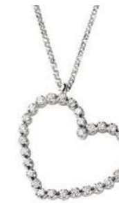
Art. CD752 24 Diam.ct.0.22 Gold 18 kt. 2.40