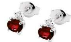
Art. OR50 Orecchini Rub.ct. 1,00 Diam.ct.0,06 Gold 18 kt. gr. 1,10