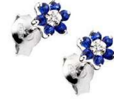
Art. OZ70 Orecchini Zaff. ct. 0,50 Diam. ct. 0,04 Gold 18 kt gr. 1,25