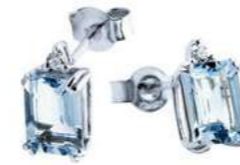
Art. OME640 Orecchini AM ct. 0.80 Diam. ct.0,03 Gold 18 kt. gr. 1,00