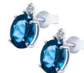
OBLO911 Orecchini TBL. ct. 8,80 Diam. ct. 0,06 Gold 18 kt. gr. 2,30