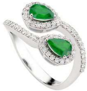
Art. ABSC-150-1 Sme. ct.1,20 mm.7x5 Diam.ct.0.55 Gold 18 kt gr. 4,90