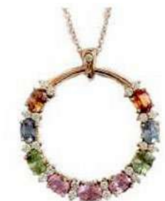
Art. CGZM-30R Zaf Mult. ct. 2,50 Diam. ct. 0,25 Gold 18 kt gr. 6,00