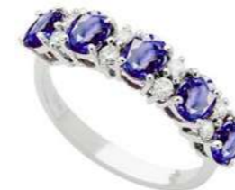
Art. AZ30 Anello Zaff. ct.2.40 Diam. ct.0,26 Gold 18 kt gr. 3,90