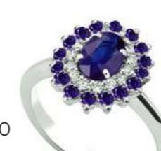
Art. AZ88Z Zaf.ct. 0,40 Zaf. ct. 0,20 Diam. ct.0,10 Gold 18 kt gr. 2,80