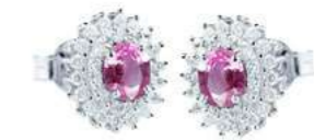
Art. OZR88 Orecchini Zaff.Rosa ct. 0,96 Diam. ct.0,60 Gold 18 kt gr. 2,80