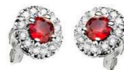
Art OR100 Rub.ct. 0.60 mm 4 Diam. ct. 0.24 Gold 18 kt. gr. 2,70