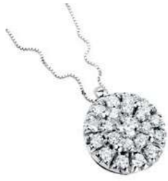
Art CD100 Diam.ct. 0.04 Diam. ct. 0.0,16 Gold 18 kt. gr. 2,00