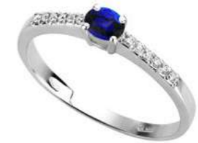
Art. AZ35-1 Zaf.ct.0,25 Diam.ct.0,10 Gold 18 kt. gr. 1,80