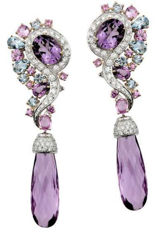
Art. OBV 8960 Ametista ct. 29.00 Zaffiro ct. 4.54 Acquamarina ct. 0.85 Diam. ct. 1.85 F-SI Gold 18 kt gr. 19.00