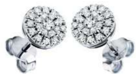
Art OD100 Diam. ct. 0,08mm Diam. ct. 0.32 Gold 18 kt. gr. 2,70