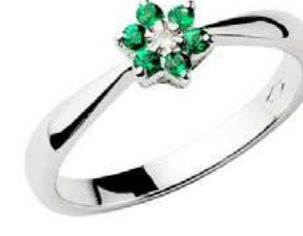
Art. AS70 Anello Sme. ct. 0,12 Diam. ct. 0,02 Gold 18 kt gr. 2,30