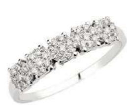
FGR78-1 Diam.ct.0,20 Gold 18 kt. gr. 1,85