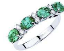
Art. AS31 Anello Sme. ct.1,35 Diam. ct.0,15 Gold 18 kt gr. 2,80