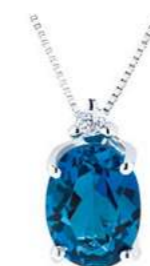
CBLO911 Pendente TBL. ct. 4,40 Diam. ct.0,03 Gold 18 kt. gr. 2,00