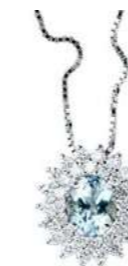
Art. CAM88 Pendente AM.ct. 0,35 Diam. ct.0,30 Gold 18 kt gr. 1,90