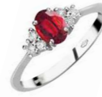
Art. AR50-2 Anello Rub. ct.0,65 Diam.ct.0,15 Gold 18 kt. gr. 1,90