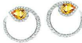
Art. OZYD-155 Zaff. Yellow ct. 0,90 mm.6x4 Diam.ct. 0,60 Gold 18 kt. gr. 4,80