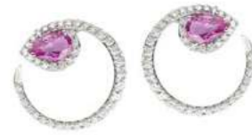
Art. OZRD-155 Zaff. Rosa ct. 0,90 mm.6x4 Diam.ct. 0,60 Gold 18 kt. gr. 4,80