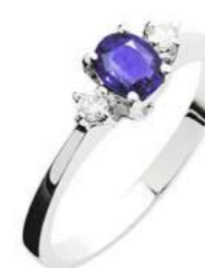
Art. ATN50 Anello Tanzanite ct.0,35 Diam.ct.0,06 Gold 18 kt. gr. 2,10