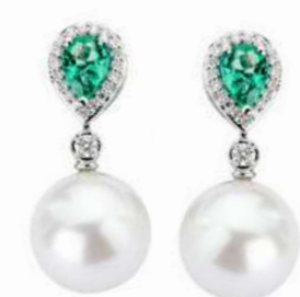
Art. OSP-166 Smeraldo ct. 1.20 Perle mm. 13 Diam.ct.0.34 Gold 18 kt gr. 3.50