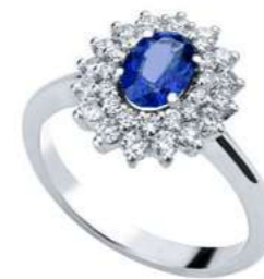
Art. AZ88 Anello Zaff.ct. 0,48 Diam. ct.0,30 Gold 18 kt gr. 2,80