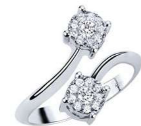
ADC77-2 Diam.ct.0,26 Gold 18 kt. gr. 3,80