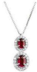
Art. C2DR-343 Rub. ct. 0,75 Diam. ct.0,30 Gold 18 kt gr. 2,30