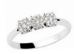
TGR78-1 Diam.ct.0,11 Gold 18 kt. gr. 1,70