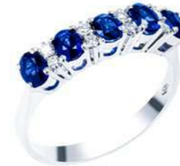
Art. AZ25 Anello Zaf. ct.1,30 Diam. ct.0,12 Gold 18 kt gr. 2,70