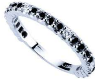
Art. FGDN 1519-20 Eternelle Diam Neri. mm.2.00 ct. 0.80 Diam.ct. 0.12 Gold 18 kt. gr. 2.50