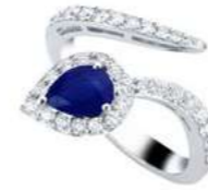
Art. ABZ-150 Zaff. ct.0,77 mm.7x5 Diam.ct.0.60 Gold 18 kt gr. 4,70