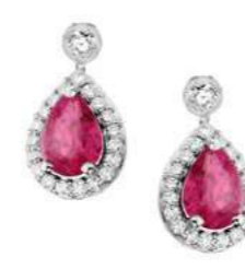
Art. ORD-166 Rub. ct.1.40 Diam.ct.0.38 Gold 18 kt gr. 3.00