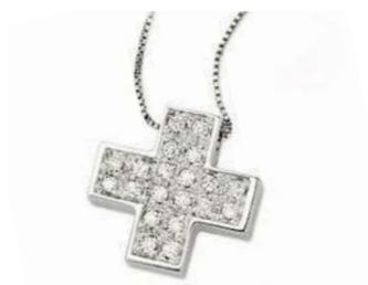
Art. CB 6160-1 Diam. ct.0.42 Gold 18 kt. gr. 3,70 Mis.cm. 1.60