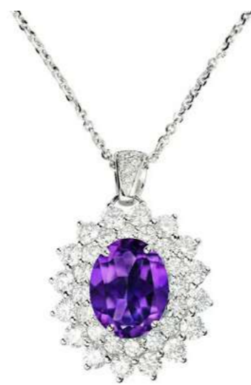
Art. CAMT 8021-2 Ametista ct. 1.90 Diam. ct. 1.45 F-SI Gold 18 kt gr. 4.90