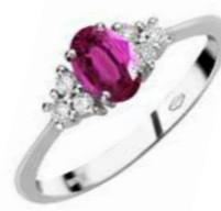
Art. AZR50-2 Anello Zaff.Rosa ct.0,60 Diam.ct.0,15 Gold 18 kt. gr. 1,90