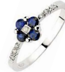
Art.AZ60 Anello Zaff. ct. 0,35 Diam. ct. 0,06 Gold 18 kt gr. 2,00