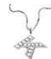
Art. CD900-K LETTERINA "K" Diam. ct.0.05 Gold 18 kt. gr. 1,45