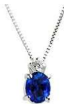
Art. CZ50/1 Pendente Zaff. ct.0,50 Diam. ct.0,03 Gold 18 kt gr. 1,10