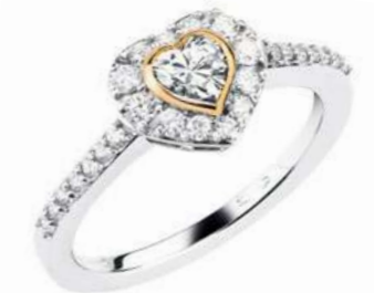
Art. ADC-340WR Diam. Cuore. ct.0,34 Diam.ct.0.25 Gold 18 kt gr. 4,50