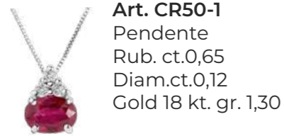
Art. CR50-1 Pendente Rub. ct.0,65 Diam.ct.0,12 Gold 18 kt. gr. 1,30