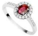
Art. AR34 Rub. ct.0,25 Diam. ct.0,15 Gold 18 kt gr. 2,30