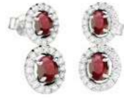
Art. O2DR-343 Rub. ct. 1,50 Diam. ct.0,60 Gold 18 kt gr. 3,30