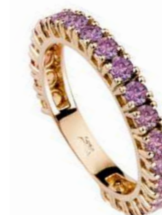
Art. FGZR-25/ FGZR-25R Eternelle Oro Bianco e Oro Rosa Zaffiri rosa mm. 2.5 ct 1.50 Gold 18 kt. gr. 2.40