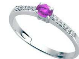
Art. AZR35-1 Zaff.Rosa ct. 0,25 Diam.ct.0,10 Gold 18 kt. gr. 1,80