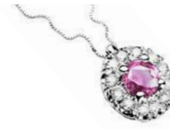
Art. CZR100 Zaff.Rosa ct.0,50 mm 4 Diam.ct.0,12 Gold 18 kt. gr. 2,00