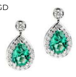
Art. OSD-166 Sme. ct. 1.20 Diam.ct.0.38 Gold 18 kt gr. 3,00