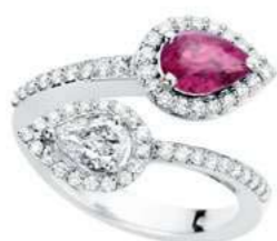
Art. AZR-166 Zaf. Rosa ct.0.80 Diam.Goccia ct.0.40 Diam.ct.0.40 Gold 18 kt. gr. 5.00