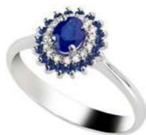
Art. CZ88-1Z Zaf. ct. 1,00 Zaf. ct. 0,20 Diam. ct.0,10 Gold 18 kt gr. 2,50