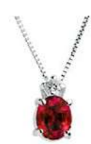
Art. CR50/1 Pendente Rub. ct.0,50 Diam. ct.0,03 Gold 18 kt gr. 1,10