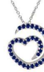
Art. CZ-300-1 Zaf. ct. 0.33 Gold 18 kt gr. 3.50