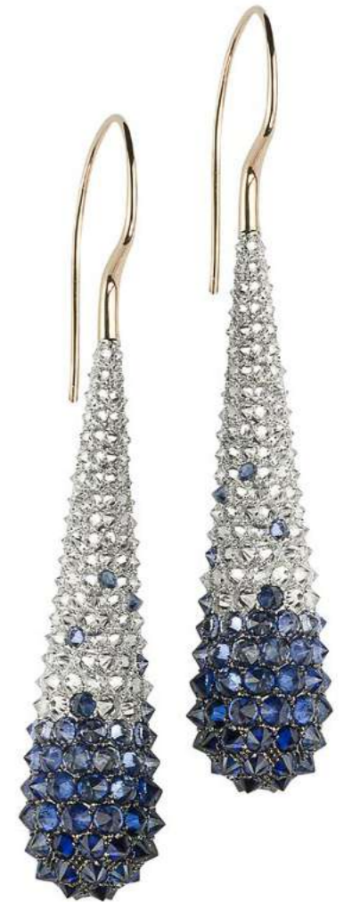
Art. OBZ 8800 Zaffiri ct. 13.00 Diam. ct. 7.00 F-SI Gold 18 kt gr. 16.00