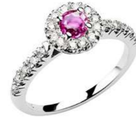
Art. AZR100 Zaff.Rosa ct.0,50 mm 4 Diam.ct.0,20 Gold 18 kt. gr. 3,00