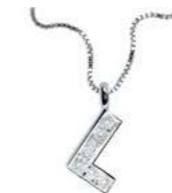
Art. CD900-L LETTERINA "L" Diam. ct.0.025 Gold 18 kt. gr. 1,17