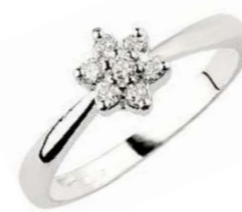
Art. AD70 Anello Diam. ct. 0,14 Gold 18 kt gr. 2,30