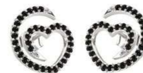
Art. ODN-300-2 Diam. neri. ct.0.65 Diam.ct.0.04 Gold 18 kt gr. 2.00