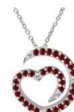
Art. CDR-300-3 Rub. ct. 0.28 Diam.ct. 0.04 Gold 18 kt gr. 1.90