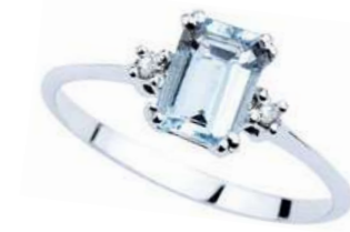
Art. AME860L Anello AM ct. 1.30 Diam. ct.0,05 Gold 18 kt. gr. 2,50