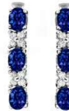
Art. ODZ-31 Zaf. ct.1.40 Diam.ct.0.20 Gold 18 kt gr. 2,00