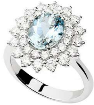
Art. AAM 8021-3 Acquamarina ct. 1.80 Diam. ct. 1.30 F-SI Gold 18 kt gr. 5.80