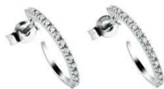
Art. OD80-180 Diam. ct.0,26 Gold 18 kt. gr. 1,80