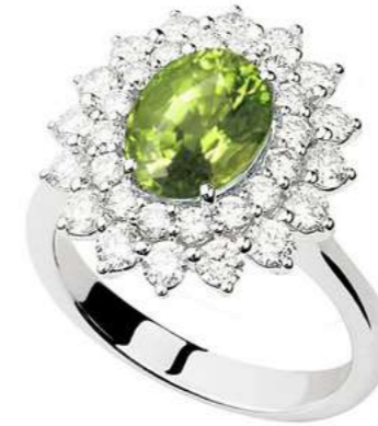
Art. APRD 8021-3 Peridoto ct. 1.80 Diam. ct. 1.30 F-SI Gold 18 kt gr. 5.80