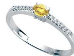
Art. AZY35-1 Zaf yellow ct.0,25 Diam.ct.0,10 Gold 18 kt. gr. 1,80