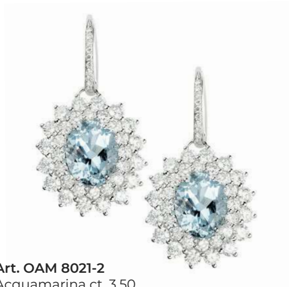
Art. OAM 8021-2 Acquamarina ct. 3.50 Diam. ct. 2.96 F-SI Gold 18 kt gr. 7.50