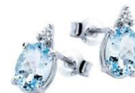
Art. OMO810 Orecchini AM ct. 4.80 Diam. ct.0,05 Gold 18 kt. gr. 1,90