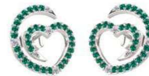
Art. ODS-300-3 Sme. ct. 0.44 Diam.ct. 0.04 Gold 18 kt gr. 2.00