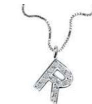
Art. CD900-R LETTERINA "R" Diam. ct.0.04 Gold 18 kt. gr. 1,25