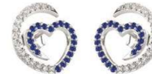
Art. ODZ-300-1 Zaf. ct. 0.34 Diam.ct.0.24 Gold 18 kt gr. 2.00