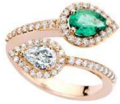
Art. ABS 166R Sme. ct.0.60 Diam.Goccia ct.0.40 Diam.ct. 0.40 Gold 18 kt. gr. 5.00