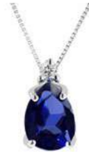
Art. CZG750 Zaffiro ct.0,80 Diam. ct.0,02 Gold 18 kt. gr. 1,10