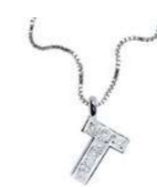
Art. CD900-T LETTERINA "T" Diam. ct.0.025 Gold 18 kt. gr. 1,25