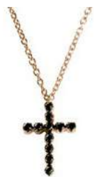
Art. CRO281R 11 Black Diam.ct.0.12 Gold 18 kt. gr. 1,70 1,4x1,1 cm