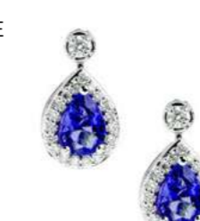
Art. OTND-166 Tanz. ct. 1.40 Diam.ct.0.38 Gold 18 kt gr. 3,00