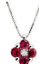
Art.CR60 Pendente Rub. ct. 0,35 Diam. ct. 0,01 Gold 18 kt gr. 1,45