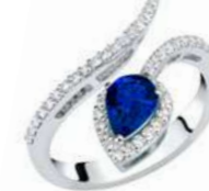
Art. ABZ-150-1 Zaff. ct.0,77 mm.7x5 Diam.ct.0.42 Gold 18 kt gr. 3,80