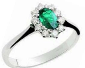
Art. AS10 Anello Sme.ct.0,50 Diam. ct.0,20 Gold 18 kt gr. 2,60