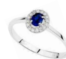
Art. AZ43 Zaff. ct.0,45 Diam. ct.0,18 Gold 18 kt gr. 2,50