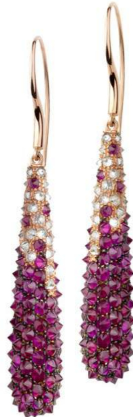
Art. OBR 8801-1 Rubini ct. 14.75 Diam. ct. 2,36 F-SI Gold 18 kt gr. 11.00