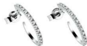
Art. OD80-150 Diam. ct.0,19 Gold 18 kt. gr. 1,45