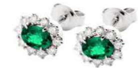
Art. OS10 Orecchini Sme. ct.1,00 Diam. ct.0,40 Gold 18 kt gr. 2,90