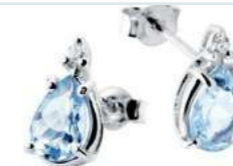
Art. OMG750 Orecchini AM ct. 1,50 Diam. ct.0,04 Gold 18 kt. gr. 1,20