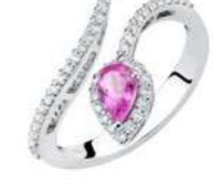
Art. ABZR-150-2 Zaff. Rosa ct.0,50 mm.6x4 Diam.ct.0.35 Gold 18 kt gr. 3,40