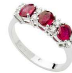
Art. AR30-3 Anello Rub. ct.1,45 Diam. ct.0,08 gr. 2,45