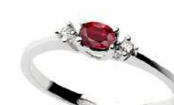
Art. AR40 Rub. ct. 0,25 Diam. ct. 0,03 Gold 18 kt. Gr. 1,50