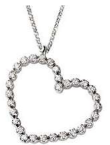
Art. CD753 30 Diam.ct.0.26 Gold 18 kt. 3.30