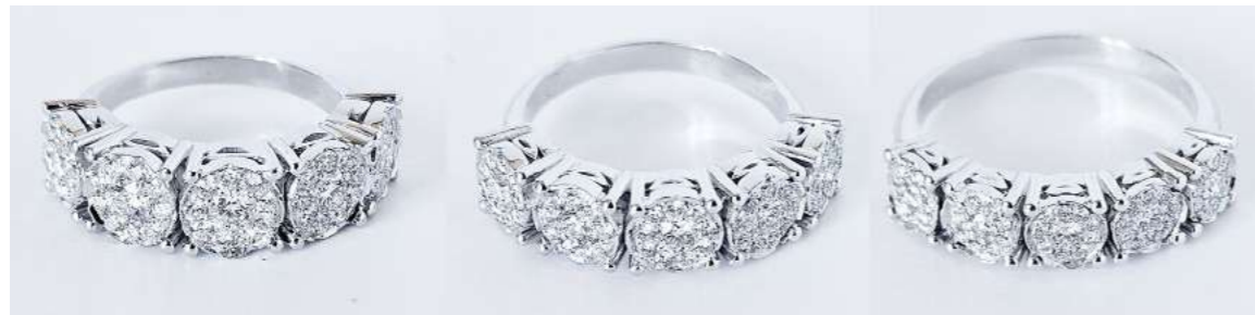
FGR78-4 Diam.ct.0,41 Gold 18 kt. gr. 4,20