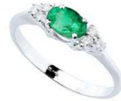
Art. AS51-1 Anello Sme. ct. 0,40 Diam. ct.0,11 Gold 18 kt gr. 2,20