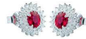
Art. OR88 Orecchini Rub. ct. 0,94 Diam. ct.0,60 Gold 18 kt gr. 2,80