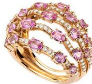
Art. ADZR 8723R Zaffiri Rosa ct.3,60 Diam.ct.0,65. Gold 18 kt. gr. 11,00