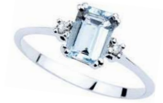
Art. AME860 Anello AM ct. 1.30 Diam. ct.0,05 Gold 18 kt. gr. 2,50