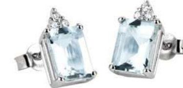
Art. OME750-3 Orecchini AM ct. 1.80 Diam. ct.0,09 Gold 18 kt. gr. 1,55