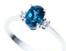
Art. ABLO750 Anello TBL ct. 0,90 Diam. ct.0,04 Gold 18 kt. gr. 1,80