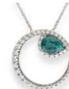
Art. CSD-155 Sme. ct. 0,60 mm.7x5 Diam.ct. 0,50 Gold 18 kt. gr. 3,30