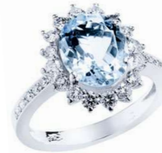
Art. AMM-108 Acquamarina ct. 2,50 mm.10x8 Diam. ct.0,75 Gold 18 kt. gr. 4,80