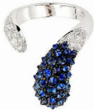
Art. ABZ 8800-1 Zaffiri ct. 2.50 Diam. ct. 0,62 F-SI Gold 18 kt gr. 8,00