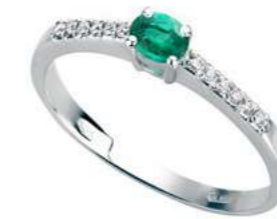
Art. AS35-1 Sme.ct.0,17 Diam.ct.0,10 Gold 18 kt. gr. 1,80