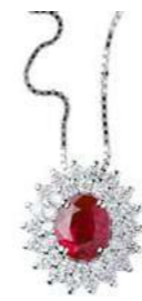
Art. CR88 Pendente Rub. ct. 0,47 Diam. ct.0,30 Gold 18 kt gr. 1,90