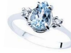
Art. AMG750 Anello AM ct. 0.60 Diam. ct.0,04 Gold 18 kt. gr. 1,90