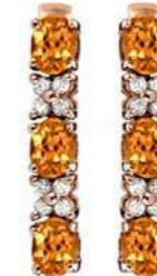
Art. ODZO-31 Zaf orange ct.1.40 Diam.ct.0.20 Gold 18 kt gr. 2,00