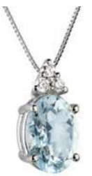
Art. CMO640-3 Pendente AM ct. 0.40 Diam. ct.0,045 Gold 18 kt. gr. 1,05