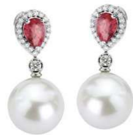
Art. ORP-166 Rub. ct.1.40 Perle mm. 12.00 Diamanti ct.0.36 Gold 18 kt gr. 3,50