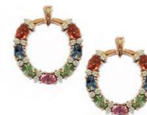
Art. OGZM-20R Zaf Mult. ct. 3,20 Diam. ct. 0,40 Gold 18 kt gr. 8,00