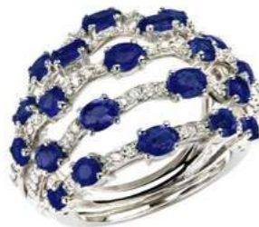
Art. ADZ 8723 Zaffiri ct.3,60 Diam.ct.0,65 Gold 18 kt. gr. 11,00