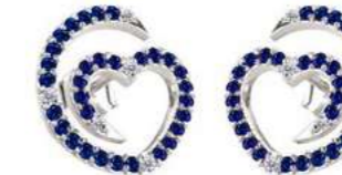
Art. ODZ-300-3 Zaf. ct. 0.56 Diam.ct. 0.08 Gold 18 kt gr. 2.00