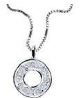
Art. CD900-O LETTERINA "O" Diam. ct.0.03 Gold 18 kt. gr. 1,37