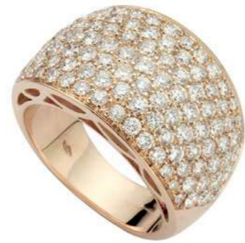
Art. ARO 8737 Diam. ct. 3.13 Gold 18 kt. gr. 13,00