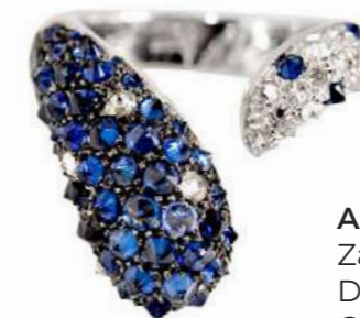
Art. ABZ 8800 Zaffiri ct. 3.62 Diam. ct. 0,57 F-SI Gold 18 kt gr. 9.30