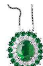
Art. CS88S Sme. ct. 0,33 Sme. ct. 0,20 Diam. ct.0,10 Gold 18 kt gr. 1,90