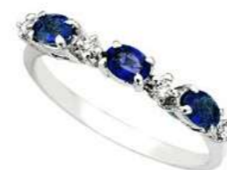
Art. TZ40 Zaf. ct. 0,75 Diam. ct. 0,05 Gold 18 kt. Gr. 1,80