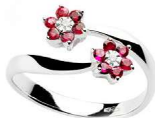
Art.AR70-1 Anello Rub. ct. 0,50 Diam. ct. 0,04 Gold 18 kt gr. 3,40