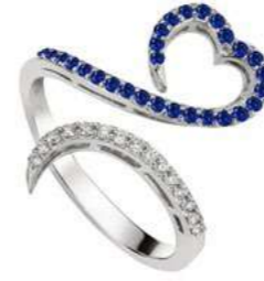
Art. ADZ-300-1 Zaf. ct. 0.30 Diam.ct.0.12 Gold 18 kt gr. 3.50