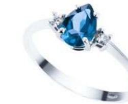
Art. ABLG750 Anello TBL ct. 0,95 Diam. ct.0,04 Gold 18 kt. gr. 1,90