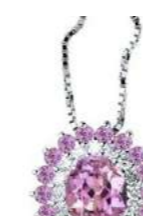
Art. CZR88ZR Zaf. rosa ct. 0,40 Zaf. rosa. ct. 0,20 Diam. ct.0,10 Gold 18 kt gr. 1,90