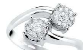
ADC78-1 Diam.ct.0,14 Gold 18 kt. gr. 3,50