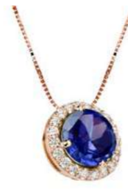
Art. CIT 160R Iolite Diam.ct.0,11 Gold 18 kt. gr. 2.10