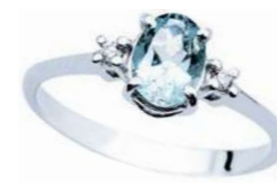
Art. AMO640 Anello AM ct. 0.40 Diam. ct.0,03 Gold 18 kt. gr. 1,50