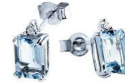
Art. OME750 Orecchini AM ct. 1,80 Diam. ct.0,04 Gold 18 kt. gr. 1,30