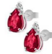
Art. ORG750 Rubini ct. 1,50 Diam. ct.0,04 Gold 18 kt. gr. 1,20