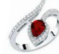
Art. ABR-150-1 Rub. ct.0,75 mm. 7x5 Diam.ct.0.42 Gold 18 kt gr. 3,80