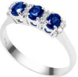
Art. AZ25-1 Anello Zaf. ct.0,70 Diam. ct.0,12 Gold 18 kt gr. 2,50