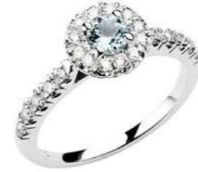
Art. AAM100 AM.ct.0,25 mm 4 Diam.ct.0,20 Gold 18 kt. gr. 3,00