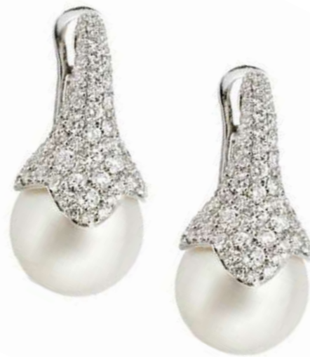
Art. OBP 8753 Perla Australia mm.14 Diam. ct. 2.46 Gold 18 kt gr. 9.50