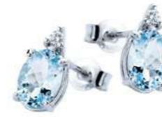
Art. OMO640 Orecchini AM ct. 0.85 Diam. ct.0,03 Gold 18 kt. gr. 0,80