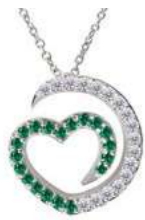
Art. CDS-300-1 Sme. ct. 0.17 Diam.ct.0.12 Gold 18 kt gr. 1.90