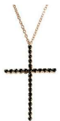
Art. CRO284R 26 Black Diam.ct.0.28 Gold 18 kt. gr. 2,70 3,0x2,0 cm

Cuori Oro rosa e Diamanti neri Rolo chain