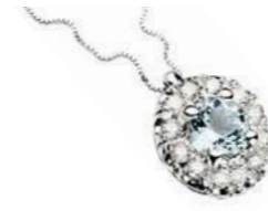
Art. CAM100 AM.ct.0,25 mm 4 Diam.ct.0,12 Gold 18 kt. gr. 2,00