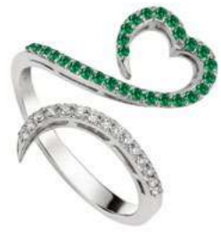
Art. ADS-300-1 Sme. ct. 0.25 Diam.ct.0.12 Gold 18 kt gr. 3.50