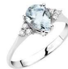
Art. AMG640-3 Anello AM ct. 0.35 Diam. ct.0,09 Gold 18 kt. gr. 2,10