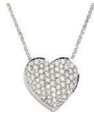
Art. CB 7815-6 Diam. ct. 0.12 Gold 18 kt. gr. 1,45 mm.0.70