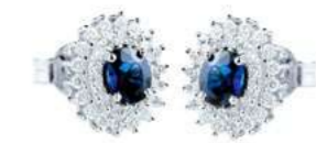
Art. OZ88 Orecchini Zaff. ct. 0,96 Diam. ct.0,60 Gold 18 kt gr. 2,80