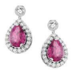
Art. OZRD-166 Zaff.rosa. ct. 1.60 Diam.ct.0.38 Gold 18 kt gr. 3.00