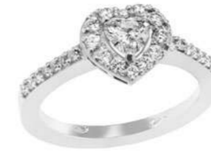
Art. ADC-340 Diam. Cuore. ct.0,34 Diam.ct.0.25 Gold 18 kt gr. 4,50