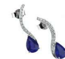
Art. ODZ-59 Zaf. ct. 1,70 Diam. ct.0.20 Gold 18 kt gr. 2.00