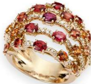
Art. ADZO 8723R Zaffiri Orange ct.3,60 Diam.ct.0,65. Gold 18 kt. gr. 11,00