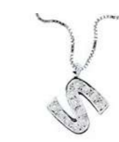
Art. CD900-S LETTERINA "S" Diam. ct.0.04 Gold 18 kt. gr. 1,35