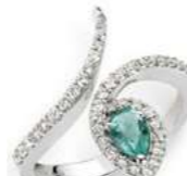
Art. ABS-155 Art. ABS-155-1 Sme. ct. 0,32 Sme. ct. 0,60 mm.6x4 mm.7x5 Diam.ct. 0,42 Diam.ct. 0,50 Gold 18 kt. gr. 4,50 Gold 18 kt. gr. 5,50