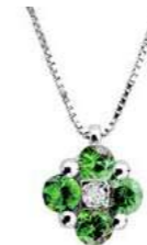
Art.CS60 Pendente Sme. ct. 0,25 Diam. ct. 0,01 Gold 18 kt gr. 1,45