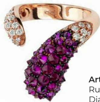
Art. ABR 8800 Rubini ct. 2.38 Diam. ct. 0,62 F-SI Gold 18 kt gr. 8.00