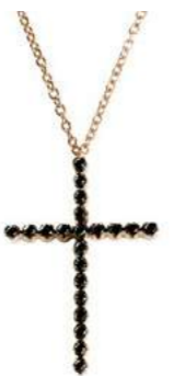
Art. CRO283R 21 Black Diam.ct.0.23 Gold 18 kt. gr. 2,50 2,9x2,0 cm