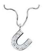
Art. CD900-U LETTERINA "U" Diam. ct.0.03 Gold 18 kt. gr. 1,22