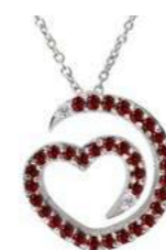
Art. CDR-300-2 Rub. ct. 0.32 Diam.ct. 0.02 Gold 18 kt gr. 1.90