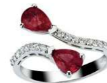
Art. ADRC-59 Rub. ct. 1,70 Diam. ct.0.35 Gold 18 kt gr. 3.90