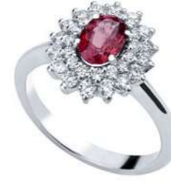
Art. AR88 Anello Rub. ct. 0,47 Diam. ct.0,30 Gold 18 kt gr. 2,80