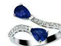
Art. ADZC-59 Zaf. ct. 1,70 Diam. ct.0.35 Gold 18 kt gr. 3.90