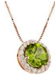
Art. CPT 160R Peridoto Diam.ct.0,11 Gold 18 kt. gr. 2.10