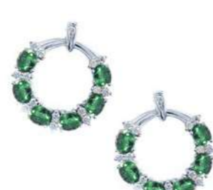
Art. OGS-20-1 Sme ct. 2.20 Diam. ct. 0.40 Gold 18 kt. gr. 6,00