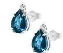
Art. OBLG860 Orecchini TBL ct. 2,75 Diam. ct.0,05 Gold 18 kt. gr. 1,30