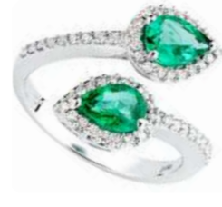
Art. ABS 165-2 2 Sme. ct. 1.20 Diam. ct.0.40 Gold 18 kt. gr. . 5.40