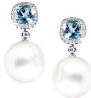
Art. OAMP-8 Perle mm. 13 Acquam.ct. 4,00 Diam. ct.0,50 Gold 18 kt gr. 4,40