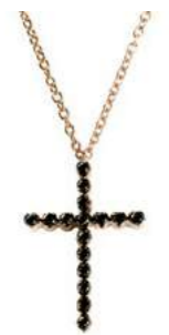
Art. CRO282R 16 Black Diam.ct.0.17 Gold 18 kt. gr. 2,00 2,0x1,5 cm