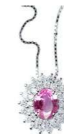
Art. CZR88 Pendente Zaff.Rosa ct. 0,48 Diam. ct.0,30 Gold 18 kt gr. 1,90