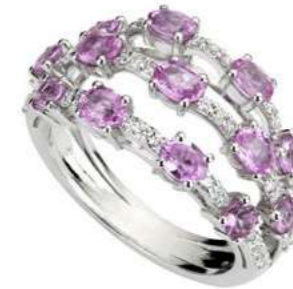
Art. ADZR 8713 Zaffiri Rosa ct.2,20 Diam.ct.0,45. Gold 18 kt. gr. 6,00