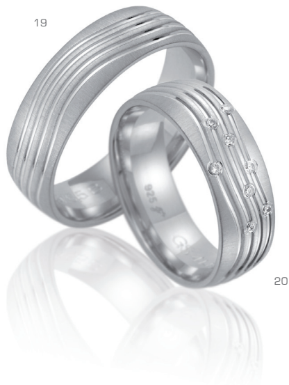
19 41459/6.5 20 41459/6.5B 8 Brill. 0.01ct, gesamt 0.08ct