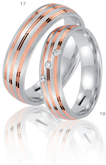
17 41466/6 18 41466/6B 3 Brill. 0.02ct, gesamt 0.06ct