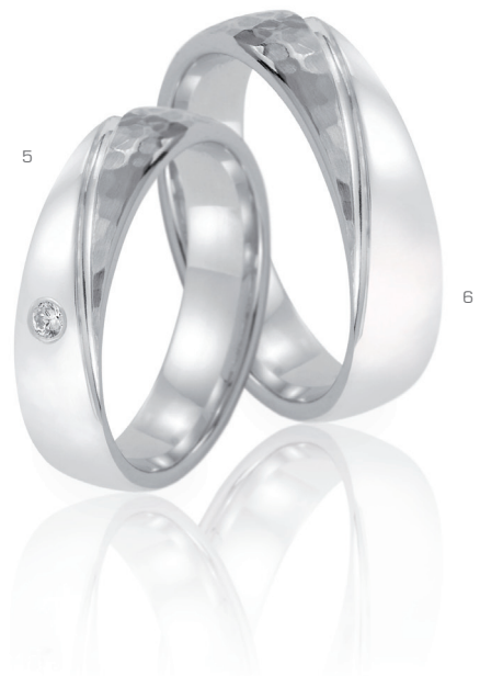
5 41457/5B 1 Brill. 0.03ct 6 41457/5