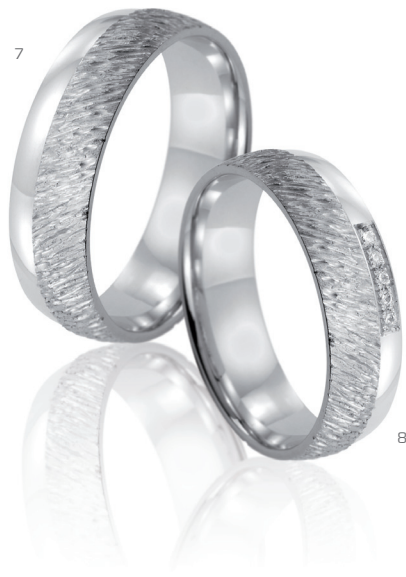
7 41455/6.5 8 41455/6.5B 5 Brill. 0.01ct, gesamt 0.05ct