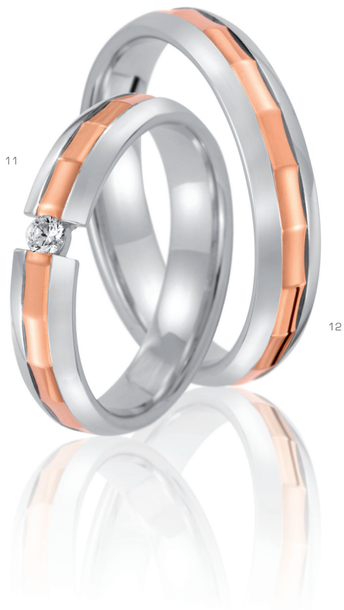
11 41465/4.5B 1 Brill. 0.05ct 12 41465/4.5