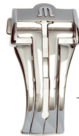
Artikel-Nr. 21015 Faltschließe Masterpiece Edelstahl, Breite: 20 mm

Passend nur für Masterpiece-Faltschließe