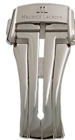
Artikel-Nr. 21022 Faltschließe Masterpiece Edelstahl, Breite: 18 mm

Passend nur für Masterpiece Faltschließe!