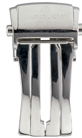
Artikel-Nr. 21016 Faltschließe Pontos Edelstahl, Breite: 18 mm