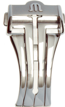
Artikel-Nr. 21015 Faltschließe Masterpiece Edelstahl, Breite: 18 + 20 mm