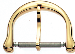
Artikel-Nr. 2999 Dornschließe Double, Breite: 12 - 18 mm