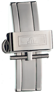
Artikel-Nr. 21012 Faltschließe Edelstahl, Breite: 16 + 18 mm