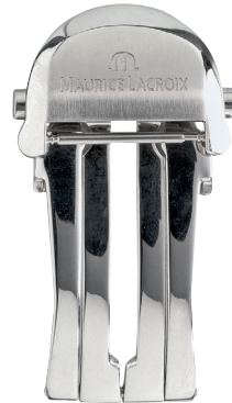
Artikel-Nr. 21020 Faltschließe Le Classic Edelstahl, Breite: 18 mm