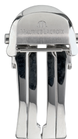
Artikel-Nr. 21020 Faltschließe Le Classic Edelstahl, Breite: 18 mm