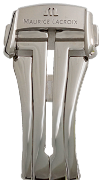
Artikel-Nr. 21022 Faltschließe Masterpiece Edelstahl, Breite: 18 mm