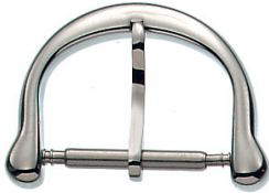
Artikel-Nr. 2998 Dornschließe Edelstahl, Breite: 12 - 18 mm