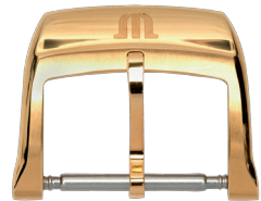
Artikel-Nr. 2997 Dornschließe Double, Breite: 14, 18 mm