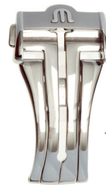
Artikel-Nr. 21015 Faltschließe Masterpiece Edelstahl, Breite: 20 mm

Passend nur für Masterpiece-Faltschließe