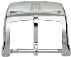
Artikel-Nr. 2996 Dornschließe Edelstahl, Breite: 14, 18 mm