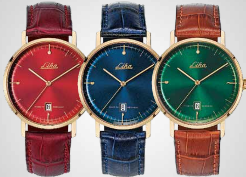
Zifferblatt Dunkelrot Armband Bordeaux