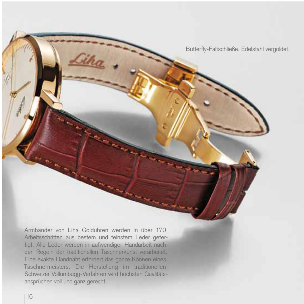
Butterfly-Faltschließe. Edelstahl vergoldet.

Armbänder von Liha Golduhren werden in über 170 Arbeitsschritten aus bestem und feinstem Leder gefertigt. Alle Leder werden in aufwendiger Handarbeit nach den Regeln der traditionellen Täschnerkunst verarbeitet. Eine exakte Handnaht erfordert das ganze Können eines Täschnermeisters. Die Herstellung im traditionellen Schweizer Vollumbugg-Verfahren wird höchsten Qualitätsansprüchen voll und ganz gerecht.