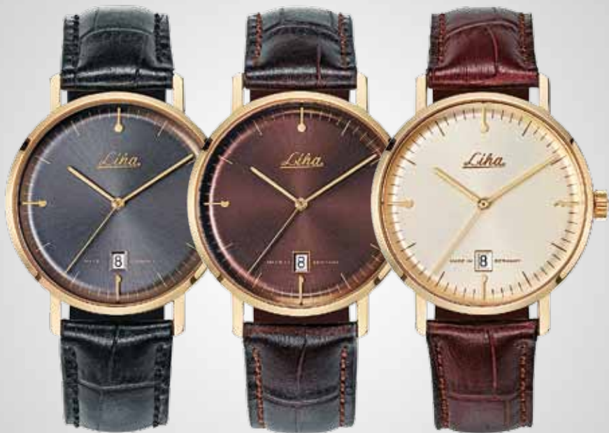
Zifferblatt Anthrazit Armband Schwarz